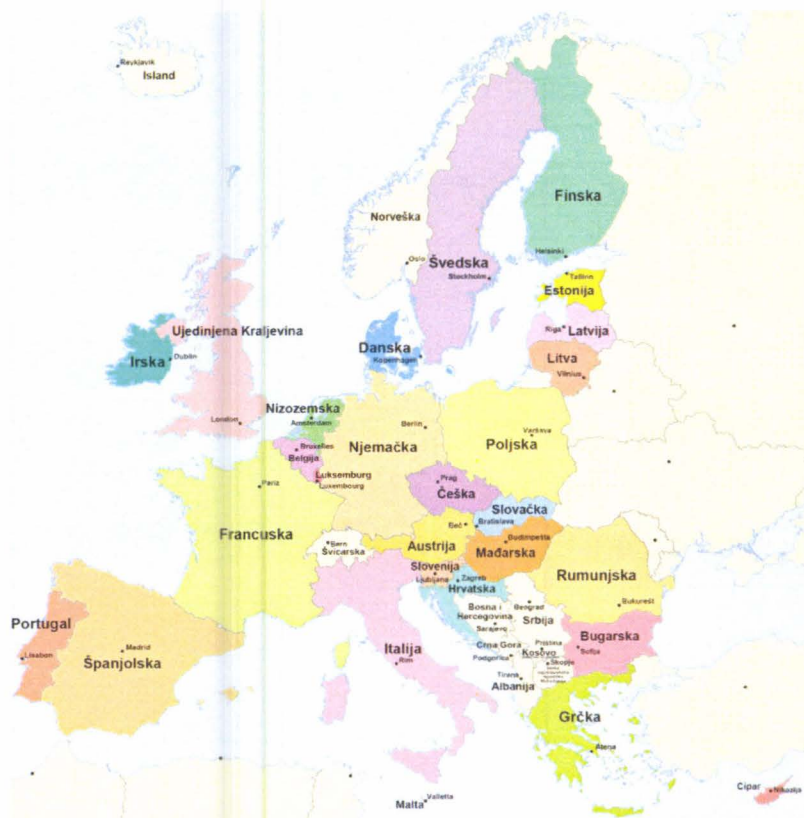
Slika 1. Države članice Europske unije