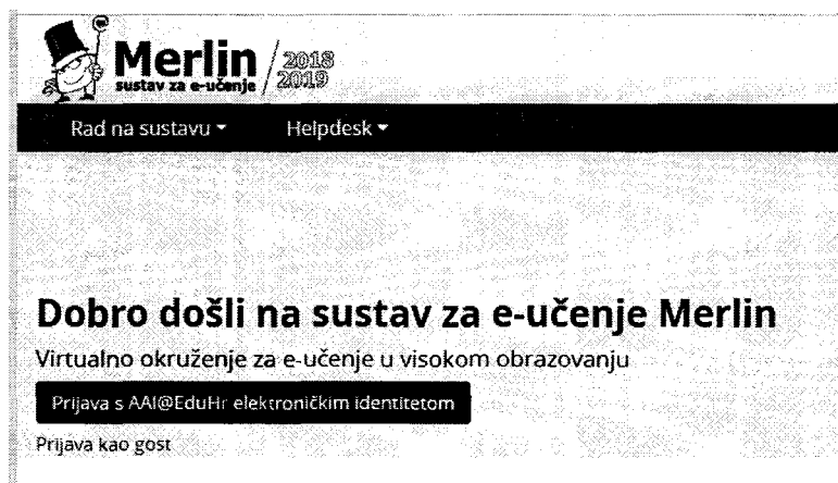
Slika 2: Prikaz naslovnice Merlina za prijavu u sustav

„Sustav za e-učenje Merlin omogućava nastavnicima, studentima i ustanovama u sustavu visokog obrazovanja izvođenje kolegija, koji se nalaze u redu predavanja pojedine ustanove, uz primjenu tehnologija e-učenja. Merlin se temelji na sustavu otvorenog koda Moodle koji je tim Centra za e-učenje Srca dodatno razradio i prilagodio potrebama korisnika te je danas najmoderniji sustav za e-učenje.“ 9