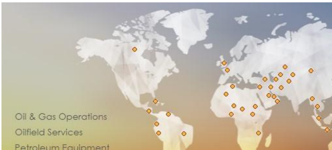
Slika 3 Države u kojima djeluje CNPC