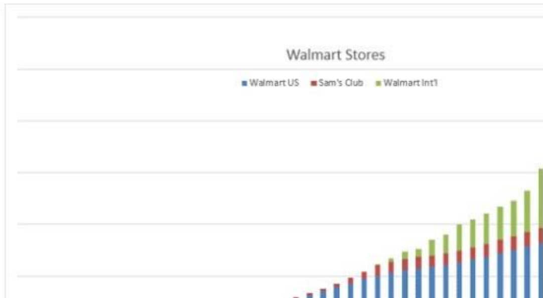
Slika 1 Rast Walmart trgovina 1968.-2012.