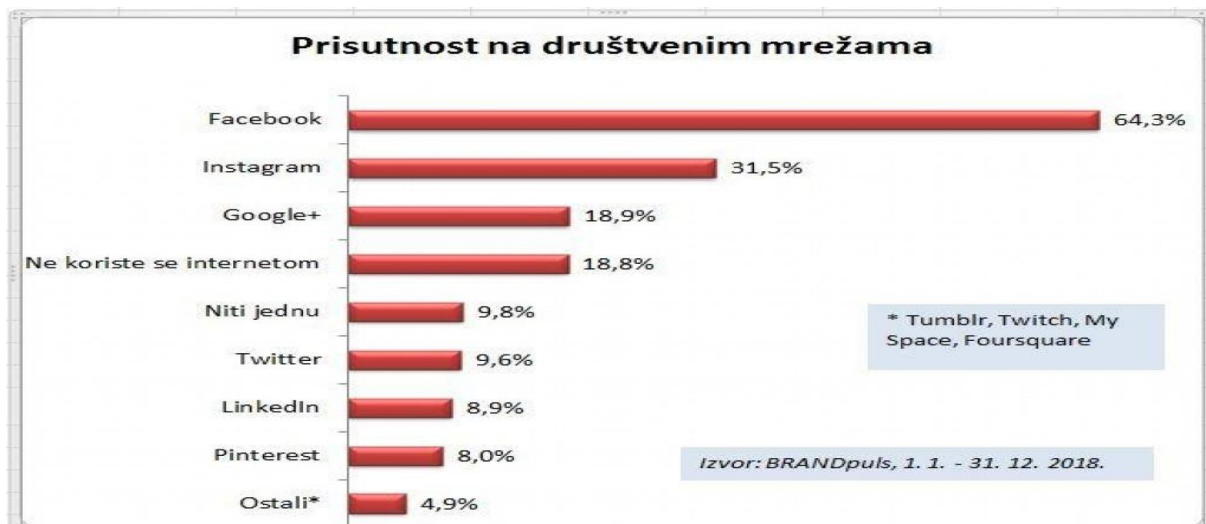
Slika 3. Najkorištenije društvene mreže u Hrvatskoj