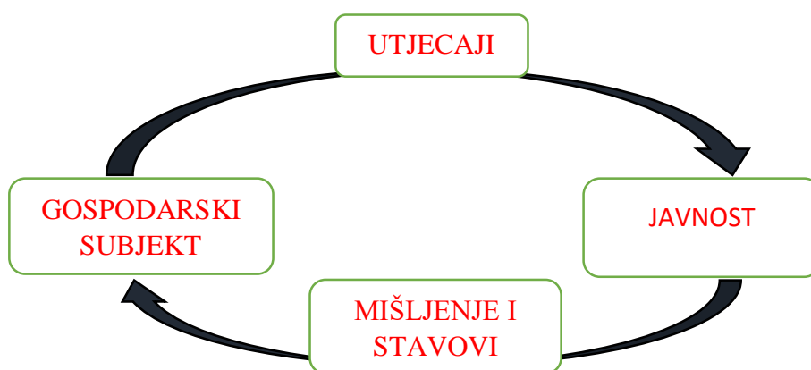
Slika 2. Komunikacijski proces u odnosima s javnošću

Meler svoju tvrdnju o odnosima s javnošću i njenom poveznicom sa gospodarskim subjektom, ali i vanjskim utjecajima te mišljenjima i stavovima kreiranim na tržištu, na vrlo jednostavan i lako shvatljiv način prikazuje na dolje navedenoj slici 2.