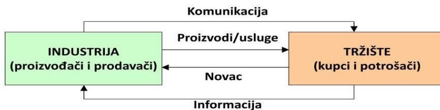
Slika 1. Jednostavni marketinški sustav

Tržište se definira kao skup kupaca i prodavatelja, drugim riječima, potrošača i prodavača. Kupci i prodavatelji komuniciraju kroz proizvode i usluge. Kao što se vidi na slici 2., jednostavan tržišni sustav koji definiraju Kotler i Keller (2016) sastoji se od industrije (proizvođači i prodavači) i tržišta (kupci i potrošači), između kojega postoji neprekidan protok proizvoda, usluga, informacija, komunikacije te novca. Ako se ovaj marketinški sustav gleda s aspekta društvenih mreža i platformi, može se zaključiti da su informacije tamo gdje je samo oglašavanje, točnije „prostor“ gdje poduzeća svojim porukama, reklamama ili preko trećih osoba (influencera) komuniciraju s potrošačem. Komunikacija u ovom slučaju predstavlja mjesto, „prostor“ na kojem potrošač daje povratnu informaciju i recenzira proizvod ili uslugu organizaciji (industriji-proizvođaču ili prodavaču). Tržište iziskuje sve veću potrebu za influencerima čija je uloga informirati i direktno komunicirati s potrošačem, te na taj način predstaviti proizvod ili uslugu i uvjeriti potrošača da mu je taj proizvod prijeko potreban. Ne žele se potpuno izbrisati neki od klasičnijih načina oglašavanja, poput televizije, radija, novina ili magazina, međutim, s povećanjem utjecaja i broja korisnika društvenih mreža i digitalnih medija, poduzeća imaju sve veću potrebu koristiti vanjske suradnike, u ovom slučaju influencere kako bi stvorili svijest o proizvodu ili usluzi.