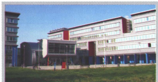
Studentski dom u Osijeku