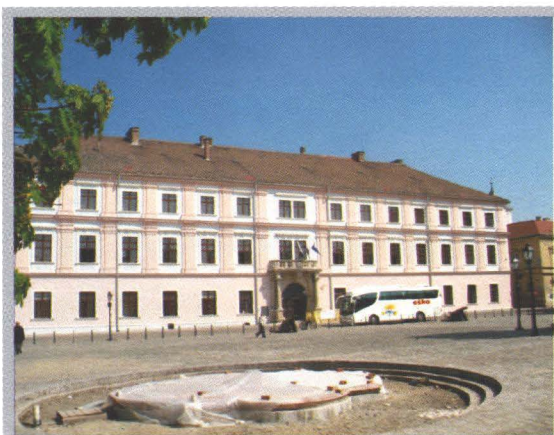
Sveučilište J.J. Strossmayera u Osijeku

U sastavu Sveučilišta u Osijeku djeluje jedanaest fakulteta (Ekonomski, Elektrotehnički, Građevinski, Katolički bogoslovni, Medicinski, Filozofski, Poljoprivredni, Pravni, Prehrambeno - tehnološki, Strojarski fakultet u Slavanskom Brodu, Učiteljski fakultet), četiri sveučilišna odjela (Odjel za matematiku, Odjel za fiziku, Odjel za biologiju i Odjel za kemiju) i Umjetnička akademija, te tri sveučilišne ustanove čija djelatnost osigurava cjelovitost i potrebni standard visoke naobrazbe: Gradska i sveučilišna knjižnica u Osijeku, Studentski centar u Osijeku i Studentski centar u Slavanskom Brodu.