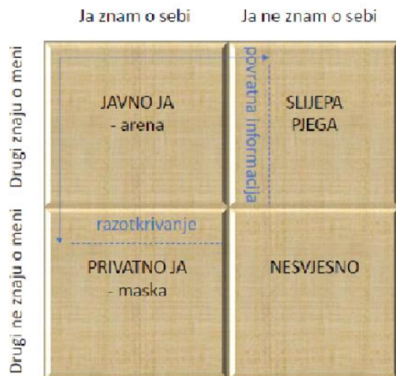
Slika 2. Johari prozor model