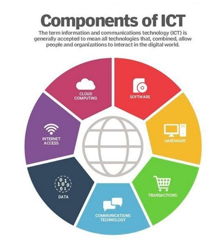
Slika 1: Komponente ICT-a