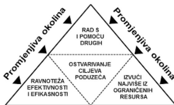
Slika 1. Ključni aspekti menadžmenta kao procesa