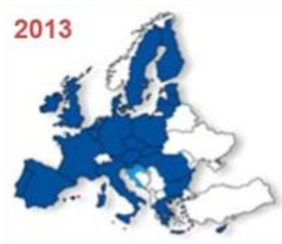
Slika 2. Pristupanje Republike Hrvatske Europskoj uniji

Izvor: ClosEUp (Europa izbliza), dostupno na: https://www.closeup-filmfestival.eu/wp-content/uploads/2014/11/2013.png