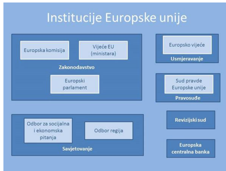
Slika 4 Organizacijska struktura institucija