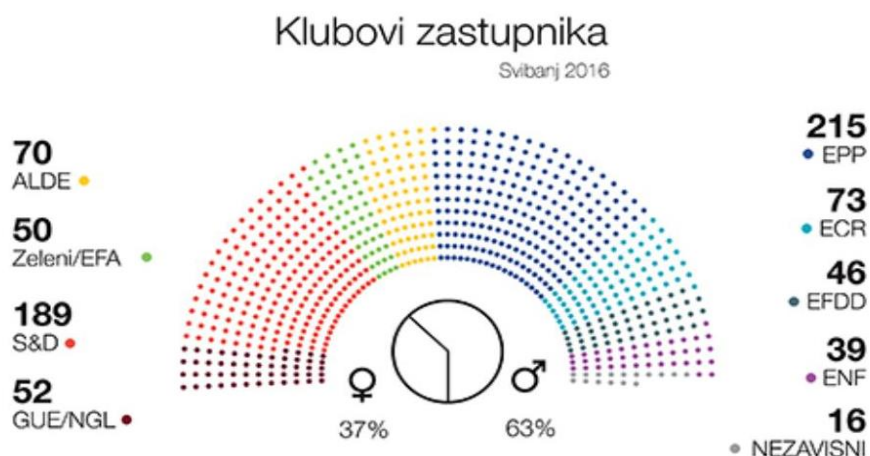
Slika 5. Klubovi zastupnika