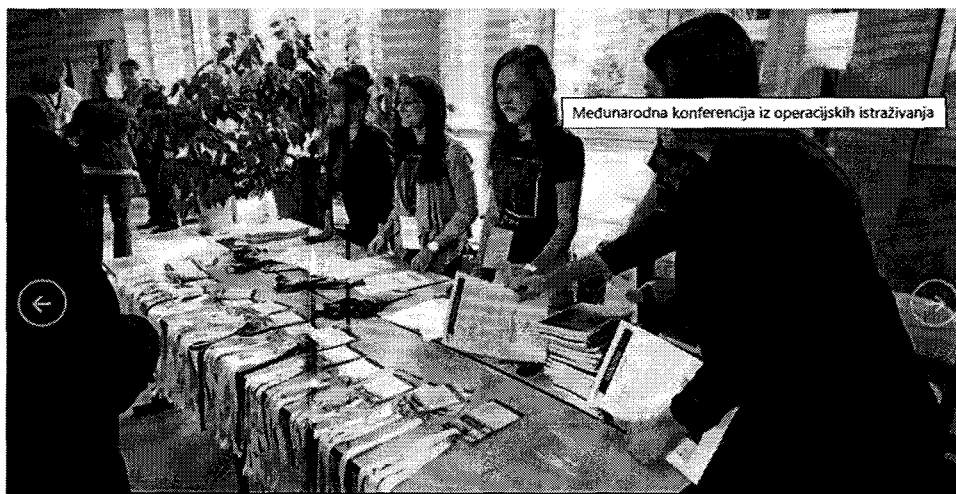
Slika 3: Međunarodna konferencija iz operacijskih istraživanja u Osijeku 2016. godine

Od 2008. do 2013. objavljuje se jedan svezak godišnje časopis koji je sadržavao odabrane radove s konferencija KOI 2010 i KOI 2012. Počevši od 5. sveska, broj 1. (2014.), časopis izlazi dva puta godišnje, a sadrži redovita izdanja izvan konferencije KOI. Također od 2014. suizdavači časopisa su: Sveučilište u Osijeku, Ekonomski fakultet; Sveučilište u Osijeku, Odjel za matematiku; Sveučilište u Splitu, Ekonomski fakultet i Sveučilište u Zagrebu, Ekonomski fakultet (Hrčak, 2020).