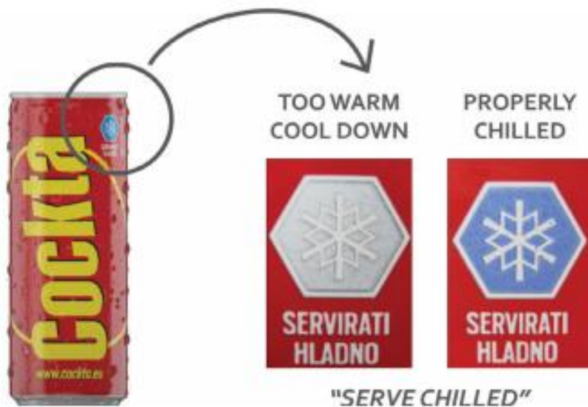
Slika 12: Indikator topline

Indikatori mogu pružiti kvalitativne ili polukvantitativne vizualne informacije o upakiranoj hrani pomoću promjene boje (npr. promjena u intenzitetu obojenja ili nepovratna promjena boje). Mogu se koristiti za pružanje informacija o temperaturi, prisutnosti plina i hlapivih tvari, promjeni pH i mikrobiološkog onečišćenja. Za razliku od senzora, indikatori ne mogu pružiti kvantitativne podatke i ne mogu pohraniti izmjerene podatke.