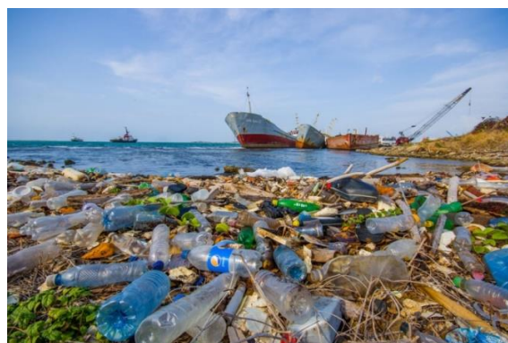
Slika 3: Plastika u oceanu

Svijest se počinje mijenjati nakon tzv. „Plavog efekta planete“. Znanstvenici i stručnjaci tvrde kako je pitanje plastike poznato već duže vrijeme, no široj javnosti nije bilo poznato koliko plastike ima u oceanima, niti koliki je njezin utjecaj na morski svijet. Premijerno prikazana 2001. godine, BBC-jeva dokumentarna serija Blue Planet otkrila je zabrinjavajuću stvarnost zagađenja naših oceana plastikom, te prvi puta postavila to pitanje u javnosti. Nakon toga izašao je Blue Planet II , također BBC-jev dokumentarac, emitiran 2018. godine koji je bio veliki hit i katalizator u osvješćivanju javnosti o zagađenju našeg okoliša.