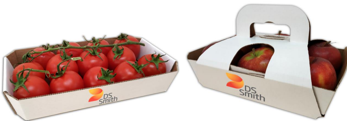
Slika 5: Primjeri ambalaže za voće i povrće

U posljednje vrijeme, industrija voća i povrća kreće se prema modelu kružnog gospodarstva. U kružnom gospodarstvu vrijednost proizvoda, materijala i resursa održava se što je duže moguće. To znači da dolazi do pravog pomaka prema korištenju obnovljivih izvora energije, uklanjanju toksičnih kemikalija i odlaganju otpada.