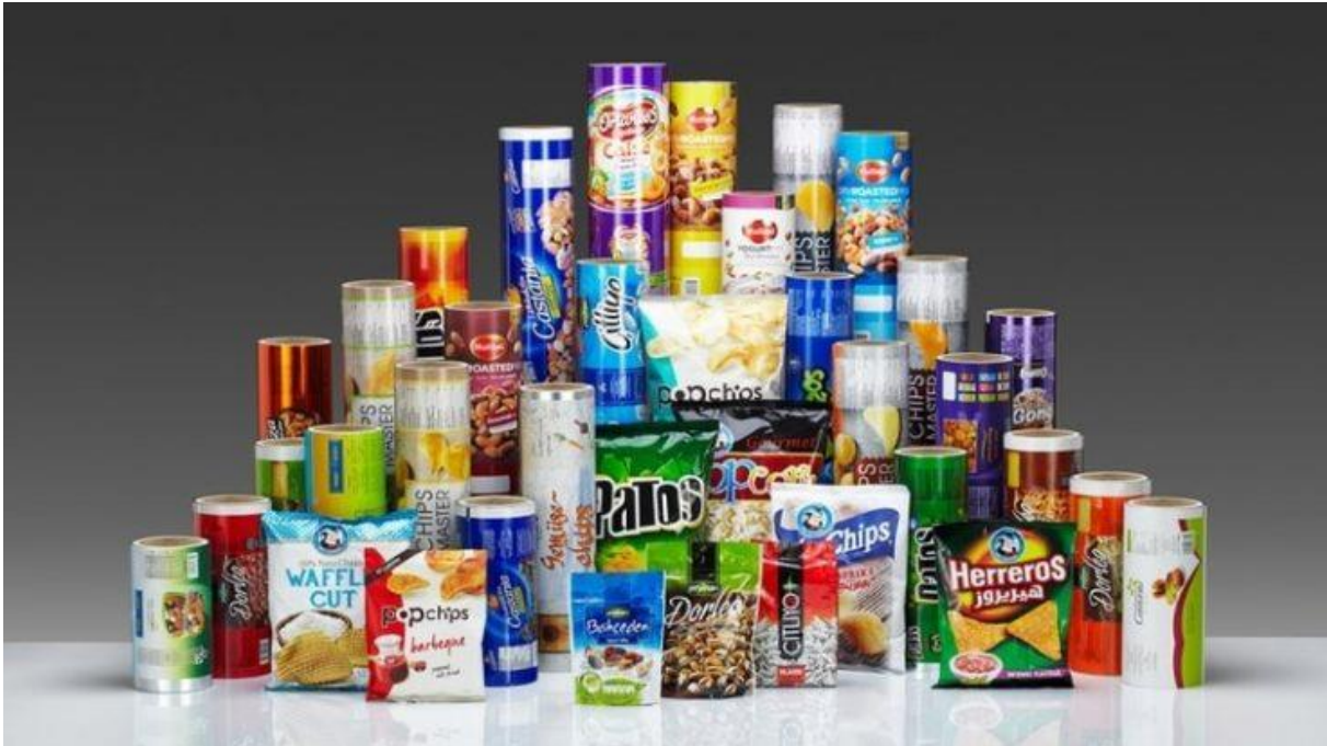
Slika 2: Vrste ambalaže

Pod pojmom ambalaže podrazumijeva se sve ono u čemu je proizvod smješten, kao i materijal kojim je proizvod omotan. Praktično sve što kupujemo i što je moguće naći na tržištu dolazi u nekoj vrsti ambalaže.