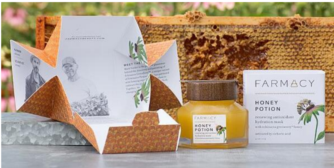
Slika 8: Primjer održive ambalaže tvrtke Natural Farmacy

Kao drugi primjer može se navesti kompanija za proizvodnju prirodne kozmetike - Natural Farmacy. Ista je osvojila nekoliko nagrada za svoju kutiju koja je inspirirana ključnim sastojkom proizvoda - medom. Šesterokutni dizajn podsjeća na saće i otvara se poput cvijeta, cijela kutija je napravljena od jednog komada kartona, što olakšava da se kasnije lako spljošti i reciklira. Također, umjesto dodavanja umetka s informacijama brenda, priča o brendu je tiskana u unutrašnjosti kutije.