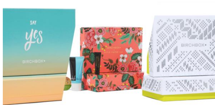
Slika 9: Primjer održive ambalaže tvrtke Birchbox