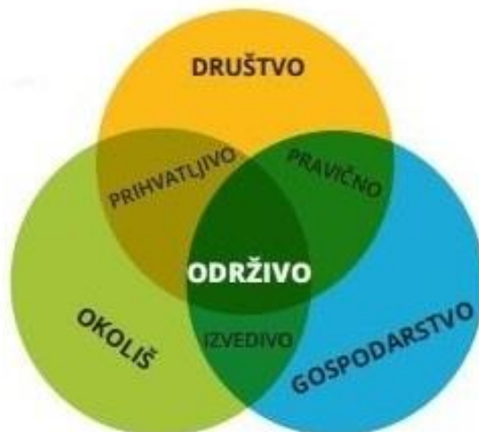
Slika 1: Stupovi održivog razvoja

Cilj održivog razvoja je trojak. On teži gospodarskoj učinkovitosti (ekonomskom razvoju) , društvenoj odgovornosti (socijalnom napretku) i zaštiti okoliša . Tri prethodno navedene stavke se još popularno nazivaju i stupovima održivog razvoja.