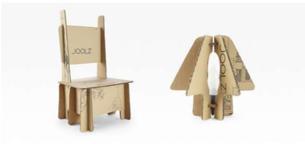
Slika 7: Primjer održive ambalaže tvrtke Joolz

Jedan od dobrih primjera svakako je kompanija za proizvodnju dječjih kolica Joolz. Ona isporučuje svoje proizvode u ambalaži koja sadrži tiskane upute kako pretvoriti karton u razne predmete koji se kasnije mogu koristiti, poput stolica, kućica za ptice ili čak sjenila za lampice. Također, umjesto zasebnog komada papira, tiskane upute se nalaze na kutiji.