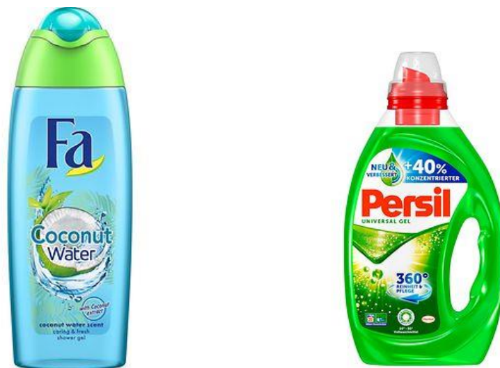
Slika 6: Primjeri Henkelove ambalaže od recikliranog PET-a

Tekućine poput gelova za tuširanje i deterdženata pakiraju se u ambalaže od recikliranog PET-a. To podrazumijeva godišnju uštedu od oko 200 tona novog PET materijala. Ugljični otisak reciklirane PET plastike je 80% niži u odnosu na sličnu novu plastiku. Zahvaljujući većoj koncentraciji formulacije i novom dizajnu boca za tekuće deterdžente za pranje rublja kao što je Persil, Henkel je uspio smanjiti ambalažu za 3.500 tona na godišnjoj razini, a navedena ambalaža se u potpunosti može reciklirati.