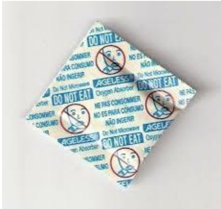
Slika 11: Slika: „Ageless“ hvatač kisika

„Ageless“ hvatači kisika su vrećice tvrtke Mitsubishi Gas Chemical, koje apsorbiraju kisik iz zraka. Mogu se koristiti za različite primjene, uključujući hranu, tekstil i elektroniku. Zbog toga što održavaju razinu kisika ispod 0,1 vol. %, štite od štetoina i sprječavaju oksidaciju ulja / masti, promjene u boji i mikrobiološki rast, što rezultira poboljšanom kvalitetom proizvoda i produženim rokom trajanja.