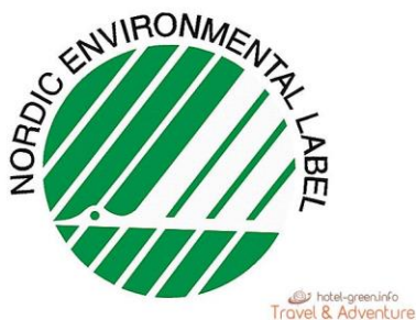
Slika br.2 Oznaka za proizvode od papira