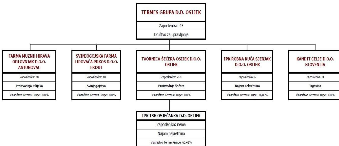
Slika 5. grupacija Termes, tvrtke kćeri

Termes grupa d.d. Osijek je Tvrtka čiji je osnovni poslovni zadatak rukovođenje s članicama Grupe u cilju ostvarivanja što boljeg poslovnog rezultata za svako Društvo Grupe. Termes Grupa d.d. Osijek je slijednik tvrtki čije poslovanje seže preko stotinu godina unatrag i čije su se tvrtke bavile proizvodnjom šećera i konditorskih proizvoda u gradu Osijeku. Danas Termes Grupa d.d. obuhvaća nekoliko tvrtki: