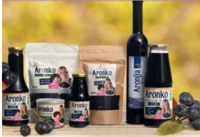
Slika 2 Asortiman tvrtke Aronia Life