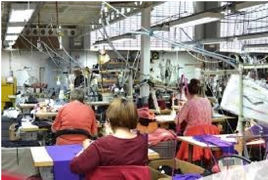
Slika 7: Pogon tvrtke Mako d.o.o.