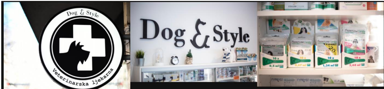
Slika 4. Logo i unutarnji izgled ljekarne Dog&Style

Kao treća vrsta usluge je ljekarna, u kojoj se nalazi dodatak prehrani, pesticidi, sredstva protiv parazita ili posebne hrane. Dog&Style nudi savjete o svemu što kupce zanima o zdravlju životinja. Zaposlenici su stručnjaci u koje kupci mogu imati potpuno povjerenje, te je ovo mjesto najbolje za kupce i njihove ljubimce (Čolak, 2021).