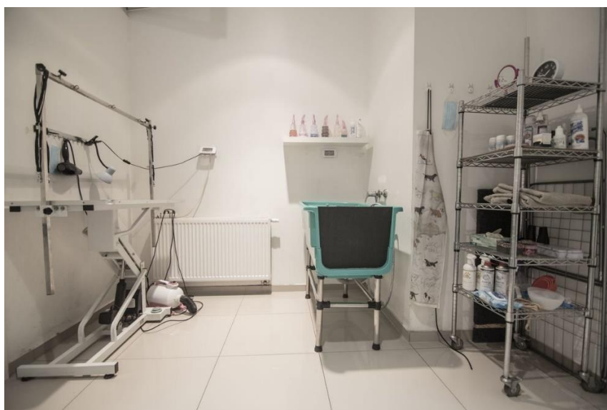
Slika 3. Izgled salona Dog&Style

Salon za uređivanje ljubimaca je za sve vrste pasa, od najmanjih do najvećih pasmina, i za mačke. U salonu se nudi uređivanje ljubimaca, kupke, medicinske kupke, skraćivanje noktiju i slično, te nude pakete u kojemu žele pomoći ljubimcima da se naviknu na salone kako bi proces uljepšavanja prošao što lakše.