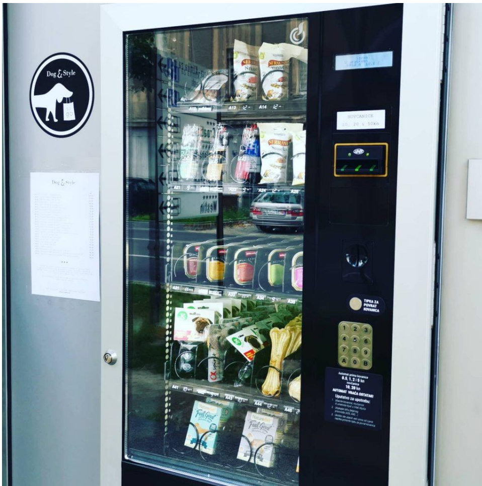
Slika 5. Slika automata s hranom Dog&Style