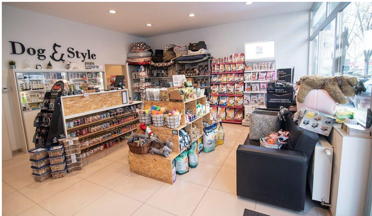
Slika 2. Trgovina Dog&Style