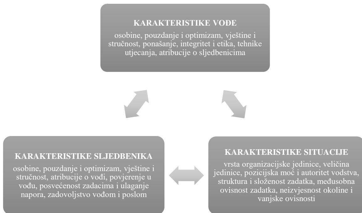
Slika 1. Ključne komponente vodstva prema Yukl (2002:11) Izrada autora

Slika 1. prikazuje međuovisnost tri navedena elementa liderstva. Može se primijetiti da se određene karakteristike sljedbenika i vođe ponavljaju što ukazuje na važnost osobina, pouzdanja, optimizma, vještina, stručnosti između oba dionika. Međuovisnost karakteristika sljedbenika, karakteristika vođe i karakteristika situacije može voditi i odrediti uspješnost ili neuspješnost organizacije. Buble (2011:19) smatra da je temeljni zadatak vodstva pronaći ravnotežu između navedenih komponenti s ciljem osiguranja uspjeha vodstva i organizacije u cjelini.