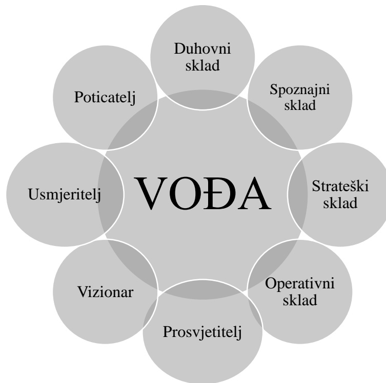
Slika 2. Obilježja vođe (Srića 2004:21) Izrada autora

U svojoj knjizi Srića (2004:21) navodi da vođa zna, hoće i može i da je upravo zato vođa. Potrebno je da vođa bude prosvjetitelj, vizionar, usmjeritelj i poticatelj te da postigne duhovni sklad, spoznajni sklad, strateški sklad i operativni sklad. Nadalje, prema mišljenju ovog autora, „Vođa je proaktivan, etičan, uporan, efikasan, zna što hoće, izabire bitno, zna uzeti vrijeme i živjeti sa stresom“ (Srića, 2004:21). Vođa mora biti puno toga. Posao vođe je zahtjevan ako vođa nije stvoren za taj posao i ne čini napore za kontinuirani osobni rast i razvoj koji u konačnici rezultira sljedbeničkim djelovanjem i ostvarenjem ciljeva i vizije.