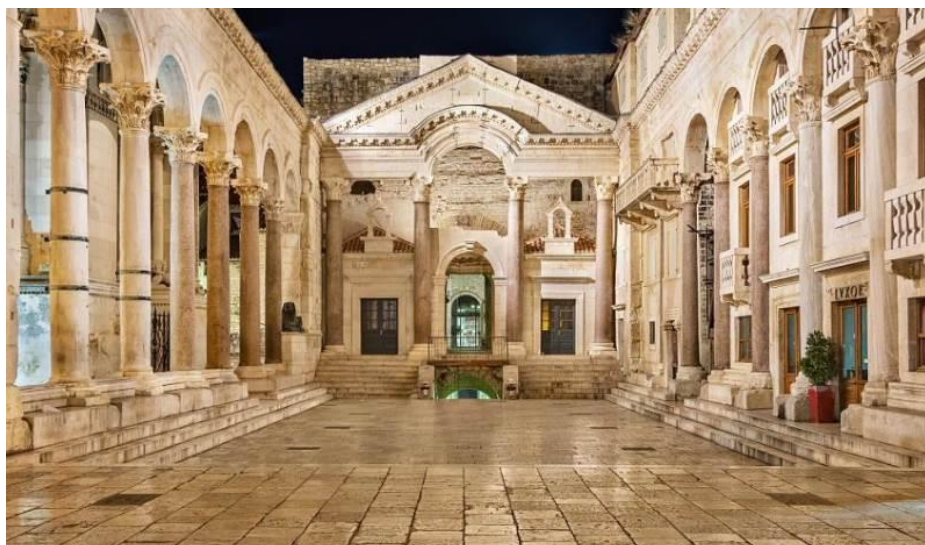
Slika 5.: Dioklecijanova palača - peristil 6

nastupe. Na lijevoj strani ulice cardo nalazio se mauzolej te današnja Splitska katedrala.