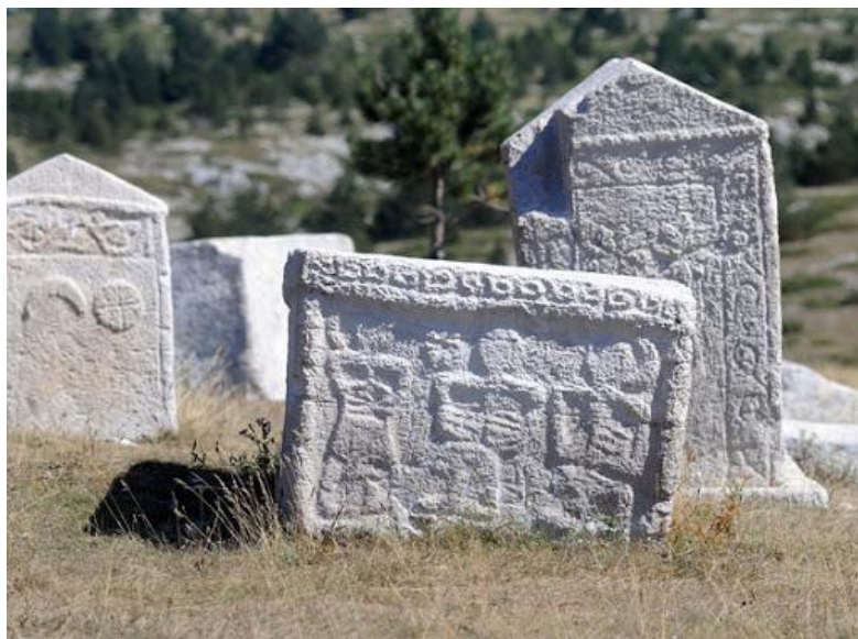
Slika 10.: Stećak 12