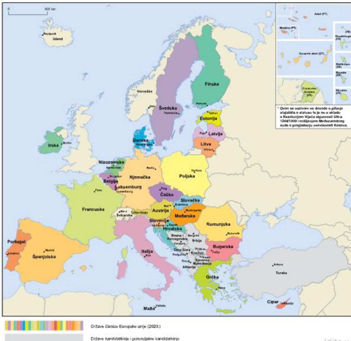
Slika 1. Države članice Europske unije

Unije te 31. siječnja 2020. godine napušta EU. EU se susreće i s novim problemima kao što su primitak ljudi koji moraju napustiti svoju zemlju radi nemira i ratova te traže utočište u Europi.