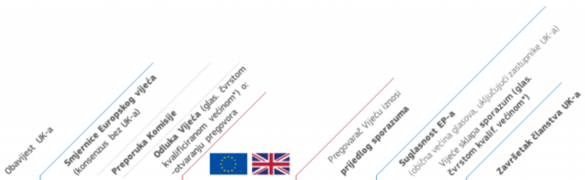
Slika 3 .Postupak izlaska Velike Britanije iz EU

Ujedinjeno Kraljevstvo zapravo odlučuje o samoj aktivaciji članka 50., ali poslije nego što članak bude aktiviran nije moguće jednostrano zaustaviti odnosno poništiti postupak. Također, vraćanje na prijašnje stanje nije moguće.