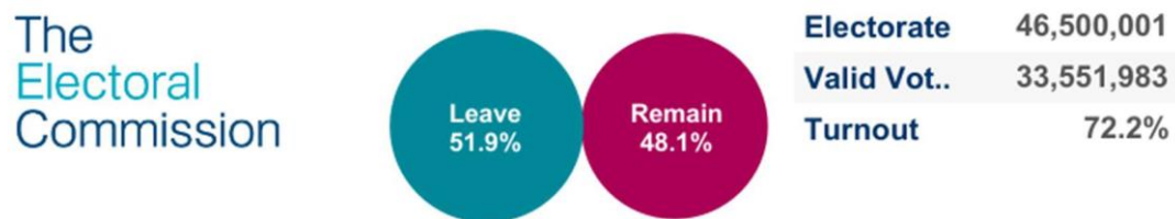
Slika 2. Rezultati referenduma o Brexitu