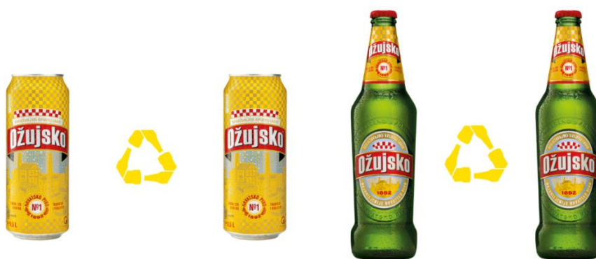
Slika 1. Reciklažna ambalaža Ožujskog piva – glavnog brenda Zagrebačke pivovare

Čak 72% svih limenki u Hrvatskoj se recikliraju, a moguće je iskoristiti čak 96,5% aluminija za novu proizvodnju limenki!