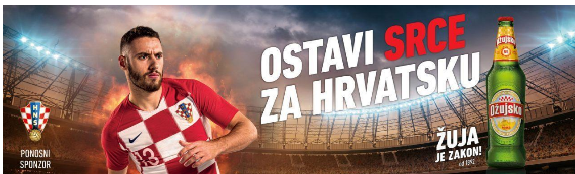
Slika 7. Vizualni identitet kampanje „Ostavi srce za Hrvatsku“ povodom EP-a

Lenta hrvatske šahovnice simbolizira dugogodišnje partnerstvo između Hrvatske nogometne reprezentacije kojoj je Ožujsko službeni sponzor od 1998. godine. Tako je i ove godine Ožujsko pivo, povodom Europskog nogometnog prvenstva kao jedan od partnera reprezentacije, lansiralo kampanju „Ostavi srce za Hrvatsku“ i u sklopu nje televizijski spot i limitiranu seriju limenki čiji su glavni ambasadori hrvatski nogometni reprezentativci Bruno Petković, Nikola Vlašić, Marcelo Brozović i Dominik Livaković (Službena stranica HNS-a).