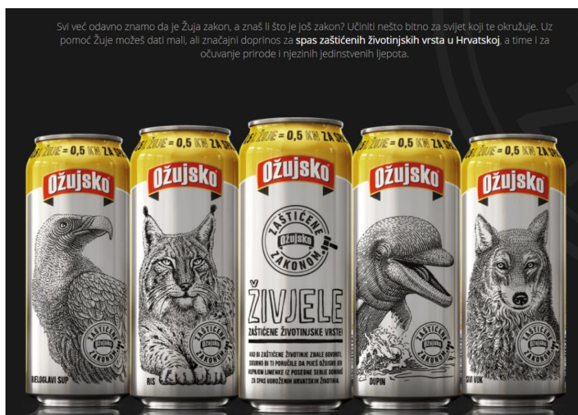
Slika 12. Novi redizajn limenki Ožujskog piva sa skicama zaštićenih životinjskih vrsta u RH