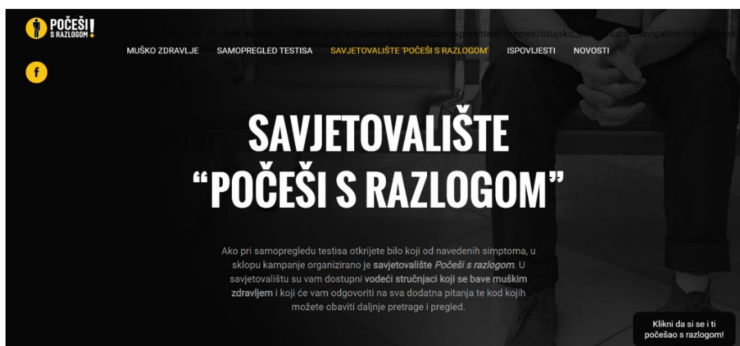
Slika 8. Naslovnica službene web stranice kampanje „Počeši s razlogom“