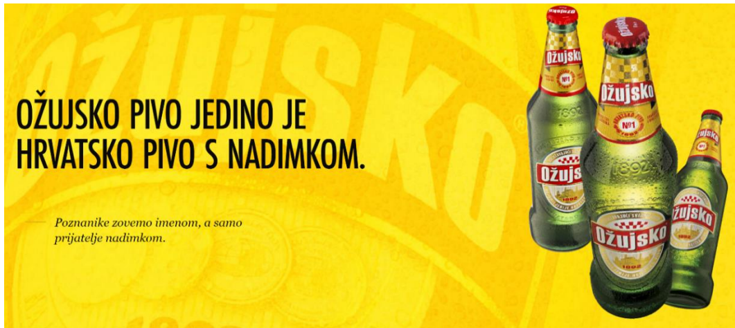
Slika 5. Vizual na službenoj stranici Ožujskog piva