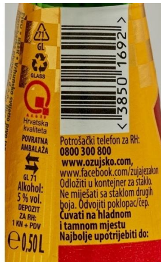
Slika 4. Etiketa Ožujskog piva