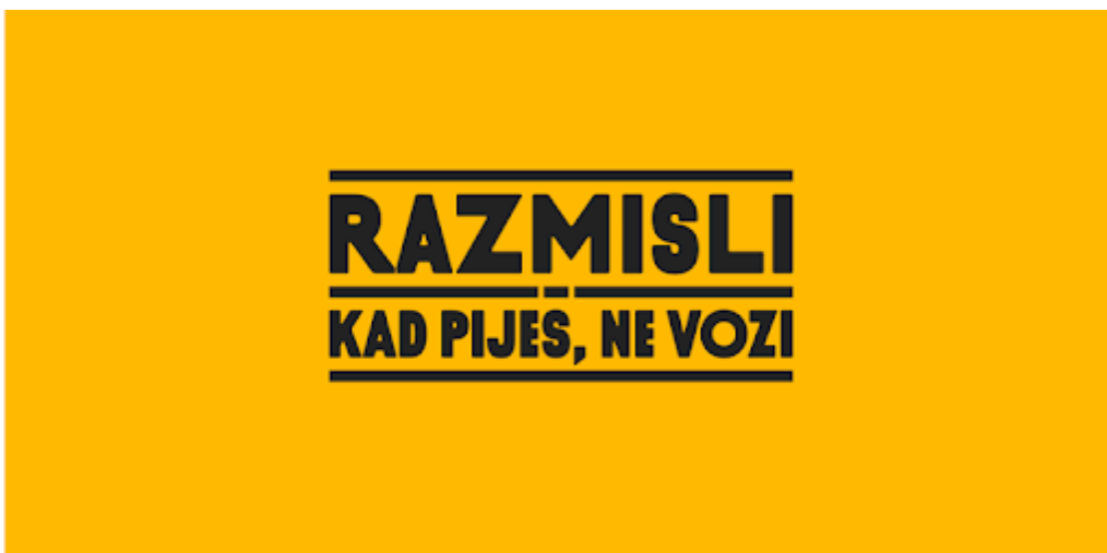
Slika 2. Vizual i komunikacijska poruka kampanje „Razmisli“ Zagrebačke pivovare