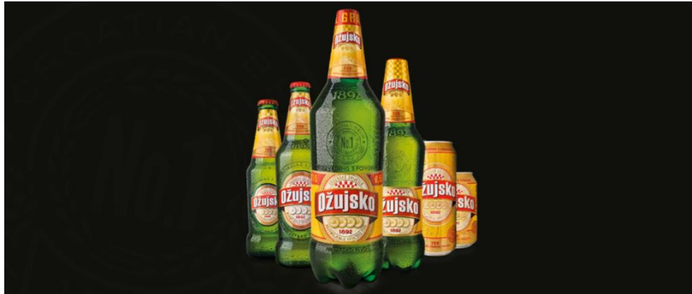
Slika 6. Razna pakiranja i ambalaža Ožujskog piva