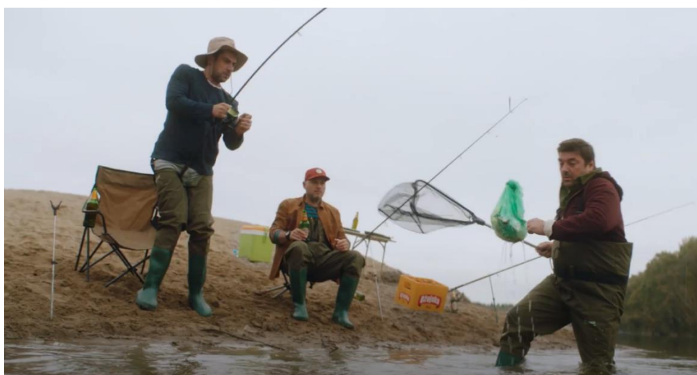
Slika 11. Kadar iz TV spota društveno odgovorne kampanje „Čuvaj, pazi ne bacaj!“