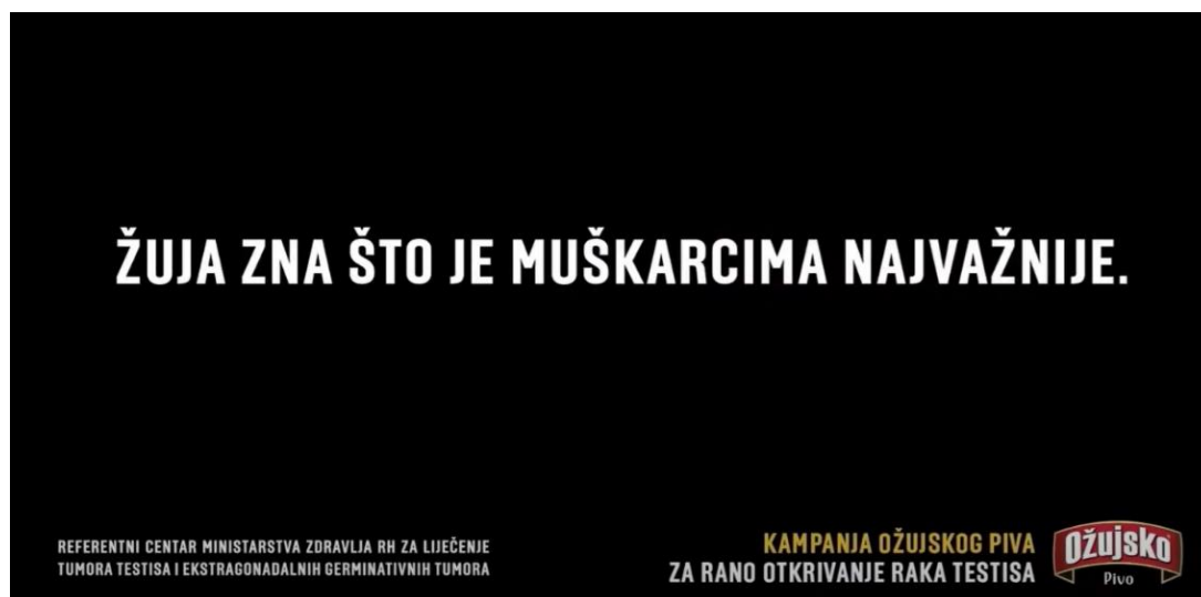
Slika 9. Vizual TV spota i ton komunikacije kampanje „Počeši s razlogom“

Glavni cilj ove kampanje bio je direktan utjecaj na spašavanje ljudskih života zbog čega je kampanja od samog početka postigla veliki interes medijske, ali i opće javnosti s kojom je ostvaren direktan kontakt kroz telefonsko savjetovalište što pokazuju i rezultati kampanje.