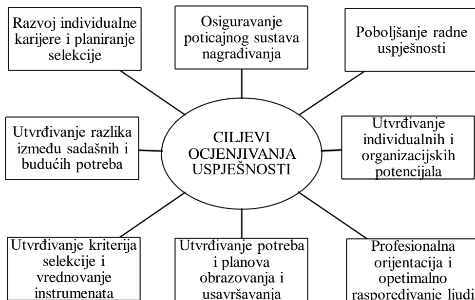
Slika 2 Ciljevi ocjenjivanja radne uspješnosti

Pravilnim određivanjem ciljeva praćenja i ocjenjivanja ljudskih resursa osigurava se uspješnost njihove procjene o kojoj ovise daljnje odluke o nagrađivanju ili kažnjavanju radnika što znatno utječe na razinu plaća i adekvatnih poticajnih metoda. Također se stvara portfolio ukupne snage i potencijala organizacije i rade se analize koje daju odgovor na pitanje odgovaraju li raspoloživi potencijali poslovnim zadacima koji su im dodijeljeni. Jedan od važnijih ciljeva ocjenjivanja je uspješno praćenje individualnih karijera što je vrlo važna stavka koju trenutačni i potencijali zaposlenici cijene i koja stvara konkurentsku prednost u današnjem poslovnom svijetu (Bahtijarević-Šiber, 1999). U nastavku, slika 2 prikazuje ciljeve ocjenjivanja radne uspješnosti o kojima je bilo riječ u ovome podnaslovu.