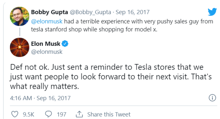
Slika 2. Elon Musk odgovara na objavu nezadovoljnog kupca

U jednoj objavi na Twitteru, kako je prikazano na slici 2., nezadovoljan kupac je naveo kako je imao neugodno iskustvo s jednim od zaposlenika u trgovini Tesla. Na tu njegovu objavu Elon Musk je osobno odgovorio i rekao kako to nikako nije dopustivo i da se nada da će svi kupci od sada imati ugodno iskustvo pri kupnji.