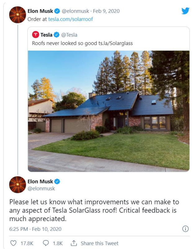
Slika 1. Objava Elona Muska na Twitteru