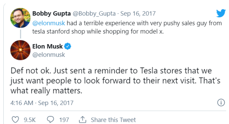
Slika 2. Elon Musk odgovara na objavu nezadovoljnog kupca

U jednoj objavi na Twitteru, kako je prikazano na slici 2., nezadovoljan kupac je naveo kako je imao neugodno iskustvo s jednim od zaposlenika u trgovini Tesla. Na tu njegovu objavu Elon Musk je osobno odgovorio i rekao kako to nikako nije dopustivo i da se nada da će svi kupci od sada imati ugodno iskustvo pri kupnji.