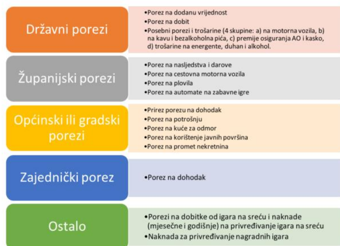
Slika 1. Prikaz hrvatskog poreznog sustava

Porezni sustav RH ima svoja načela, odnosno, mora biti jednostavan, također jeftin, treba povećavati privlačnost ulaganja kada su u pitanju inozemni investitori, mora sadržavati poreznu neutralnosti, mora i omogućiti pravednu i ravnomjernu raspodjelu poreznog tereta i porezima se treba opskrbiti proračun, naravno kroz novac. Porezna reforma, koja je bila 2017.godine imala je ciljeve poput poticanja konkurentnosti gospodarstva, izgradnje pravednijeg sustava, smanjenje ukupnog poreznog opterećenja, održiv, stabilan, jednostavan porezni sustav koji treba podrazumijevati ukidanje nekonkurentnih rashoda i širenje porezne osnovice.