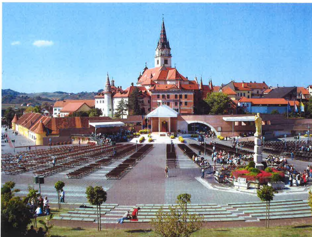
Slika 2. Primjer religijskog turizma u Hrvatskoj - Marija Bistrica