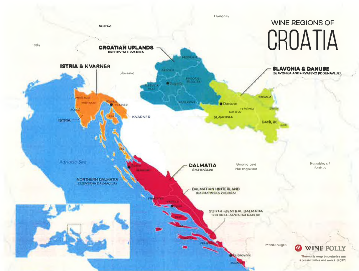
Slika 3. Vinske regije u Hrvatskoj

Turističko putovanje kroz vinski turizam podrazumijeva posjetu vinarijama, vinogradima, izložbama vina, pri čemu degustacija vina ima primarnu motivaciju.