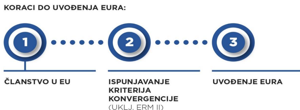
Slika 3. – Koraci u procesu uvođenja eura

Prema Strategiji za uvođenje eura kao službene valute u RH, osim o mogućnosti zemlje pristupnice da ispuni definirane uvjete, varira i o potpori ostalih zemalja pripadnica euro-područja prilikom pristupanja u valutni mehanizam ERM II. Slika 3. prikazuje Korake u procesu ulaska u Europsku monetarnu uniju i uvođenja eura kao nacionalne valute.