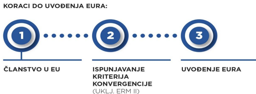
Slika 3. – Koraci u procesu uvođenja eura

Prema Strategiji za uvođenje eura kao službene valute u RH, osim o mogućnosti zemlje pristupnice da ispuni definirane uvjete, varira i o potpori ostalih zemalja pripadnica euro-područja prilikom pristupanja u valutni mehanizam ERM II. Slika 3. prikazuje Korake u procesu ulaska u Europsku monetarnu uniju i uvođenja eura kao nacionalne valute.