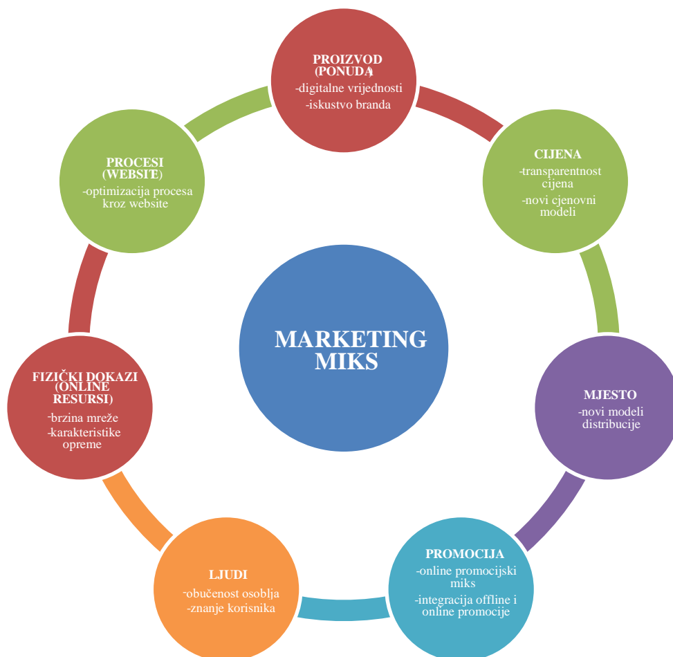
Grafikon 1.: Marketinški miks e-marketinga (7P)