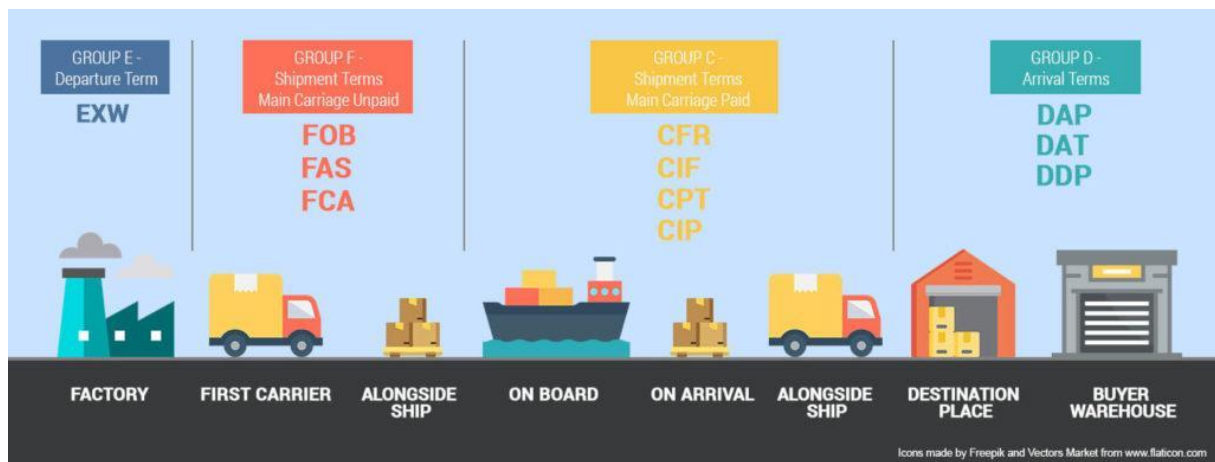
Slika 1.: Podjela INCOTERMS® pravila po glavnim grupama

Shipment term main Carriage paid , hrv. termin rok i glavni prijevoz plaćen) i Grupa D (engl. Arrival Terms hrv. uvjeti dolaska). ( https://fbabee.com/incoterms/ ) Svaku osnovnu grupu čine INCOTERMS® pravila po kojima se definiraju odgovornosti pri sklapanju ugovora o kupoprodaji, obveze prodavatelja i kupca, te troškove prijevoza između prodavatelja i kupca. Koje će se pravilo INCOTERMS® primijeniti, ovisi o sklopljenom kupoprodajnom ugovoru između prodavatelja i kupca, vrsti i načinu prijevoza. Ukoliko nastane šteta, njihovom pravilnom primjenom može se utvrditi točka prijenosa rizika s prodavatelja na kupca ili s kupca na prodavatelja, odnosno tko će snositi troškove štete. Na slici 1. prikazana je podjela INCOTERMS® pravila po glavnim grupama. (ICC,2019.)