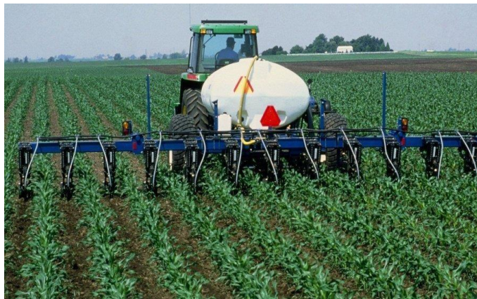
Slika 1: Tretiranje poljoprivredne površine u intenzivnoj proizvodnji

Zaključak je da se intenzivna poljoprivredna proizvodnja uvelike ovisi o kemikalijama koje ubrzavaju rast i prinos, ali isto tako negativno utječe na floru i faunu tj. općenito na okoliš. Uporaba kemijskih sredstava u poljoprivredi negativno utječe na 397 vrsta, te je prouzrokovala gubitak od 75 % genetske raznolikosti usjeva i domaćih životinja (Cifrić I., 2002).