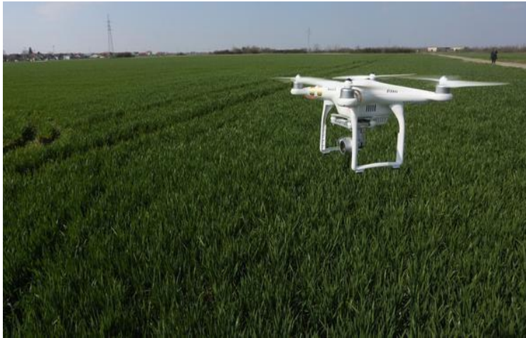
Slika 7: Snimanje njive dronom

Svjedoci smo kako je poljoprivredna tehnologija svakim danom sve modernija. Poznato nam je kako postoji tehnologija koja omogućuje navigaciju koji se putem GPS karte mogu pratiti strojevi na poljoprivrednoj površini (gorivo, položaj....).