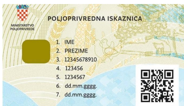
Slika 4: Poljoprivredna iskaznica

Upis u Upisnik obiteljskih poljoprivrednih gospodarstava obavezan je za poljoprivredna gospodarstva koja traže tj. koja su podnijela zahtjev za poticaj, te za obiteljska gospodarstva koja na tržištu prodaju vlastite poljoprivredne proizvode, što znači da ona poljoprivredna gospodarstva koja nisu upisana u Upisnik nemaju pravo na državne poticaje kao ni na prodaju vlastitih poljoprivrednih proizvoda (Narodne novine, Pravilnik o Upisniku obiteljskih poljoprivrednih gospodarstava ( NN 62/2019 ), 2019).