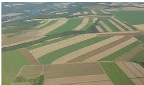
Slika 5: Ratarska proizvodnja

OPG Stiplošek u svojoj poljoprivrednoj proizvodnji bavi se ratarstvom. Ratarstvo je uz stočarstvo jedna od grana poljoprivrede, a također pripada disciplini koja se isključivo odnosi na biljnu proizvodnju ali i proučava biljke na oranicama, livadama i pašnjacima koje su predviđene za prehranu ljudi i stoka. U Republici Hrvatskoj je prema popisu iz 2003. godine od ukupnih poljoprivrednih površina, na oranice i vrtove na kojima se uzgajaju ratarske kulture otpada 1 460 000 ha, dok na livade i pašnjake otpada 1 553 000 ha. Najznačajnije ratarske kulture su kukuruz, pšenica, krumpir, ječam i soja (Leksikografski zavod Miroslav Krleža, Ratarstvo, 2021).