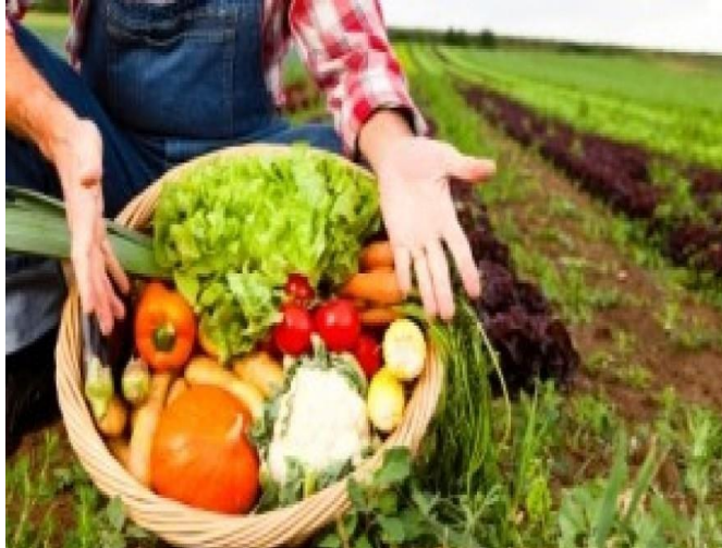
Slika 2: Ekološka proizvodnja hrane

Zdrava odnosno ekološka hrana može se proizvesti i u industrijskoj tj. intenzivnoj proizvodnji ali samo po strogim ekološkim uvjetima odnosno kriterijima jer ekološki proizvodi kako je ranije navedeno su proizvodi koji nisu tretirani kemikalijama i umjetnim gnojivima koji potiču rast usjeva (Cifrić I., 2002).