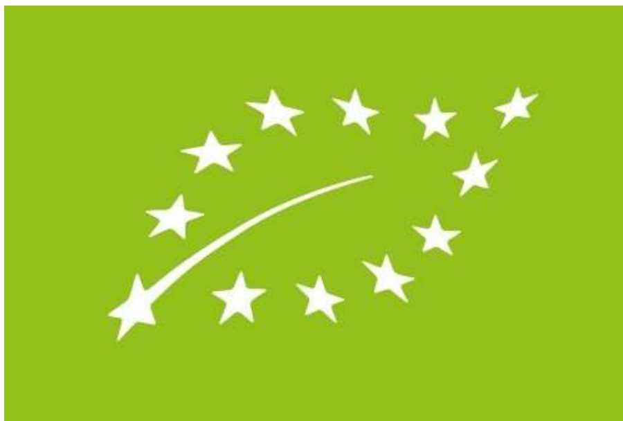
Slika 3. - Oznaka EU za eko proizvode

Predstavljeno je sveukupno sedamnaest mjera od kojih ekološki uzgoj predstavlja najvažniju mjeru tog programa. Provedbom te mjere cilj je usmjeriti proizvođače hrane na ekološku proizvodnju jer se ista smatra kao održivim načinom gospodarenja jer vodi brigu o očuvanju okoliša, odnosno štiti tlo, vodu i zrak (Uprava za potpore poljoprivredi i ruralnom razvoju, 2014).