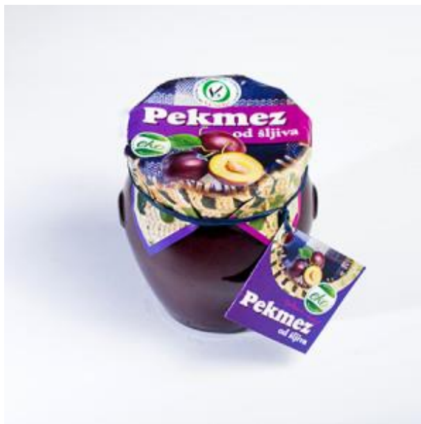
Slika 11. Eko proizvod - pekmez od šljiva - OPG Veselić