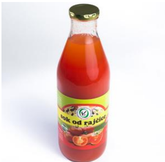
Slika 10. Eko proizvod – sok od rajčice – OPG Veselić