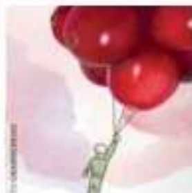
Slika 8. Fotografija i ilustracija