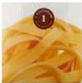
Slika 6. Fotografija