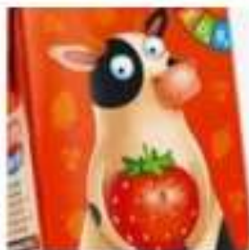
Slika 7. Ilustracija