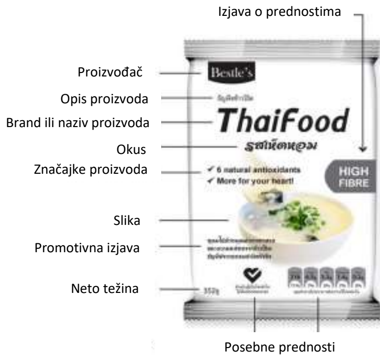
Slika 3. Grafički elementi na pakiranju (prednja strana)

Meyers i Lubliner (1998.) izjavili su da grafički dizajn na ambalaži treba vizualno komunicirati. Cilj mu je poticati trgovinu. Grafički dizajn strategija je koja doprinosi uzrocima kupovnog ponašanja (Limchaiyawat, 2002.) Etikete služe za prepoznavanje proizvoda ili marke i objašnjavanje činjenica koje se odnose na proizvode kao što su proizvođači, distributeri te kako ga koristiti. Osim toga, također služi za promicanje i jačanje atraktivnosti proizvoda (Tuntiwongwanich, 2002.)