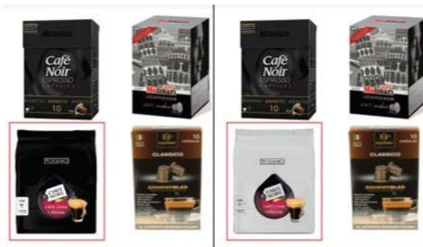
Slika 2. Prikaz manipulacije svjetline boje ambalaže kave

Svjetlina boje ambalaže manipulirana je aplikacijom Photoshop CS6 na ambalaži kave. Za oštrinu, svjetlinom se manipuliralo mijenjanjem pozadine ambalaže proizvoda na 75-85% u uvjetima svijetle boje i 25-35% u tamnoj boji. Ostali vizualni elementi, poput logotipa marke i slika proizvoda na ambalaži proizvoda, ostali su netaknuti. Percepcija kvalitete mjerena je pomoću Likertove ljestvice pomoći izjave "Čini se da je proizvod dobre kvalitete", pri čemu je 1 = "ni malo se ne slažem", a 7 = "potpuno se slažem". Nadalje, tržišna pozicija marke (tj. „Percepcija marke“, low-end do high-end) izmjerena je pomoću izjave „Očekujem da je ovo vrhunski proizvod ” na skali od 1 do 7. Sudionici su također procijenili cijenu proizvoda pomoću klizača, u rasponu od 50 - 150 centi.