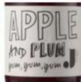
Slika 9. Samo tekst