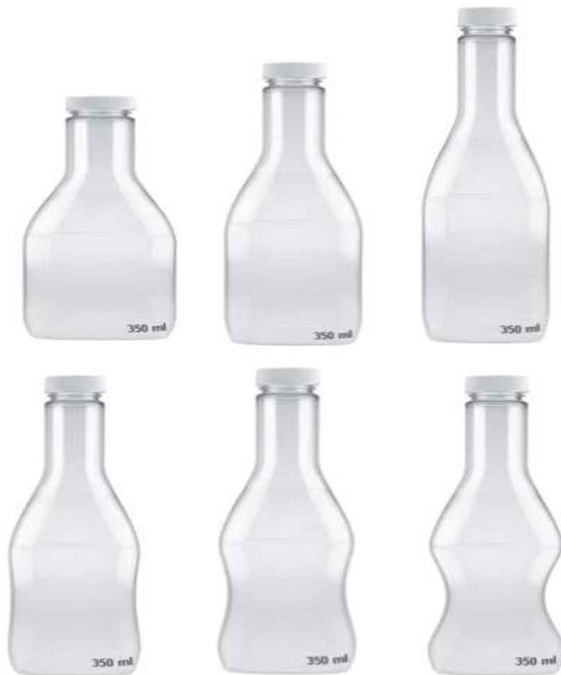
Slika 1. Primjer manipulacije dizajna ambalaže za postizanje percepcije o zdravosti proizvoda

ambalaže. U kombinaciji sa takvim dizajnom, korištenje fraza kao što je fitness ili biti u formi (tj. biti zdrav, ali i 'uklapati se' u nešto) održava postojanje takvog metaforičnog odnosa.