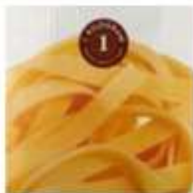
Slika 6. Fotografija