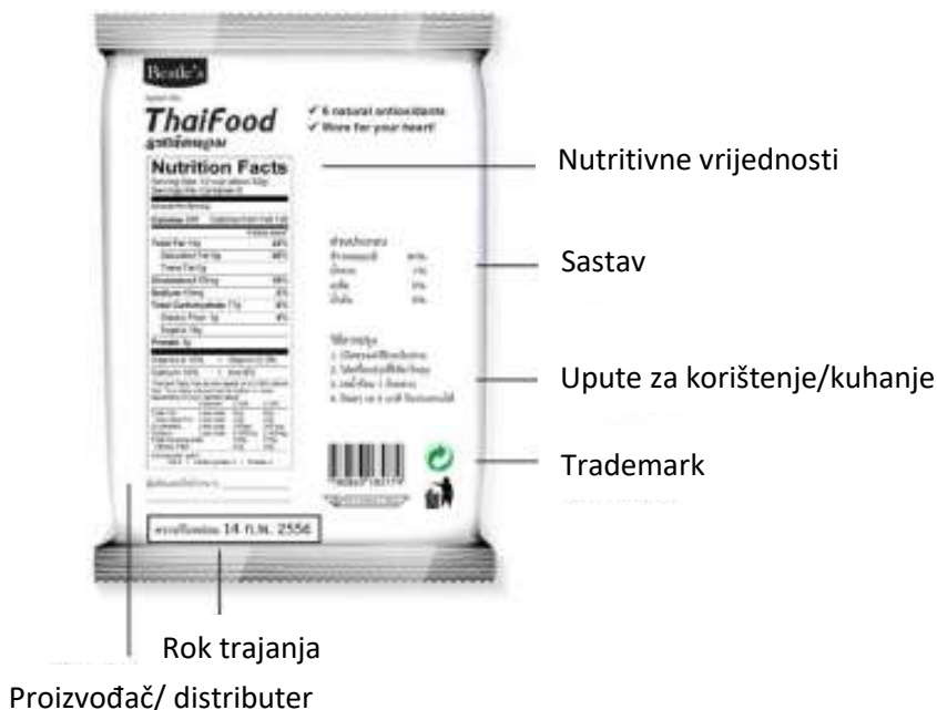
Slika 4. Grafički elementi na pakiranja (stražnja strana)