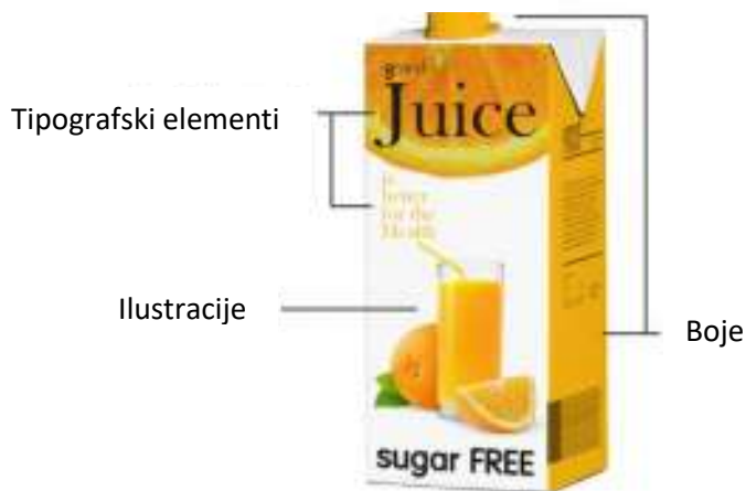
Slika 5. Grafički estetski elementi pakiranja

Estetska grafika ambalaže obično se sastoji od 2 aspekta, a to su grafički elementi koji opisuju proizvod ( Slika 3. i Slika 4.) i Grafički estetski elementi ( Slika 5.). Estetska grafika sastoji se od tri dijela: prvi dio su tekstualni elementi koji jasno prikazuju opis proizvoda, sastav i ostale poruke koje moraju biti lake za čitanje i zanimljive. Drugi dio su slike koje maštu prenose u stvarnost i povezuju s funkcijom proizvoda te privlače pažnju, objašnjavaju koncepte i informiraju o izgledu. Napokon, boja se bavi emocionalnim reakcijama i ponekad ovisi o pozadinskim iskustvima potrošača. Na primjer, ružičasta konvencionalno pripada djevojčicama dok plava pripada dječacima, bijela predstavlja čistoću, a crvena se odnosi na znakove opasnosti i zaustavljanja (Asawangkura, 2008.).