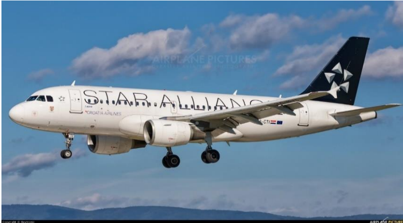
Slika 1. Zrakoplov Airbus CTI

amortizaciju i akumulirane gubitke od umanjenja vrijednosti. Revalorizacija se provodi dostatnom učestalošću kako knjigovodstvena vrijednost ne bi značajno odstupala od one koja bi bila utvrđena korištenjem fer vrijednosti na datum izvještavanja.“ (Croatia Airlines d.d.)