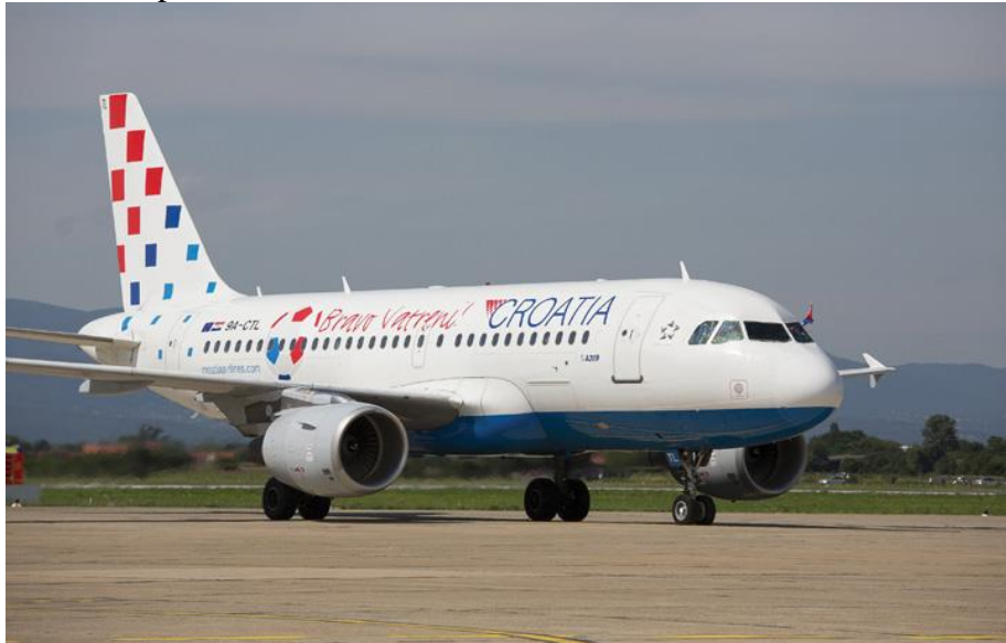
Slika 2. Zrakoplov Airbus 320