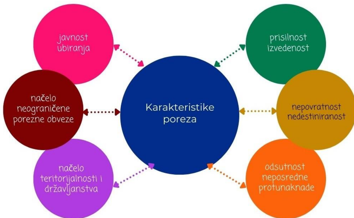
Slika 1: Karakteristike poreza (Izrada autora na temelju Jelčić, B. (2001.). Javne financije , Zagreb: RRF plus.)

Najvažnija vrsta javnih prihoda u današnje vrijeme su porezi pa se vrlo često moderne države nazivaju i poreznim državama. Upravo zbog toga što su porezi sastavni dijelovi svih modernih zajednica te su se mijenjali zajedno s povijesnim promjenama država u kojima se provode ne postoji njihova opće prihvaćena definicija. „Porez je obvezano davanje koje pojedinci daju državi radi podmirenja izdataka nastalih u javnom interesu, neovisno o posebnim pogodnostima koje bi iz toga proizašle“ (Seligman 1925., navedeno u Jelčić, 2001:27). „Porezima nazivamo javna davanja bez pravnim propisima utemeljenog zahtjeva za protučinidbom“ (Zimmermann, 1994., navedeno u Jelčić 2001:27). „Za razliku od pristojbi, porezi nisu direktna naknada za određene usluge države i ubiru se prisilno“ (Suffort, navedeno u Jelčić 2001:27). Iz svih navedenih definicija primijeti se da se određene formulacije o porezima ponavljaju.