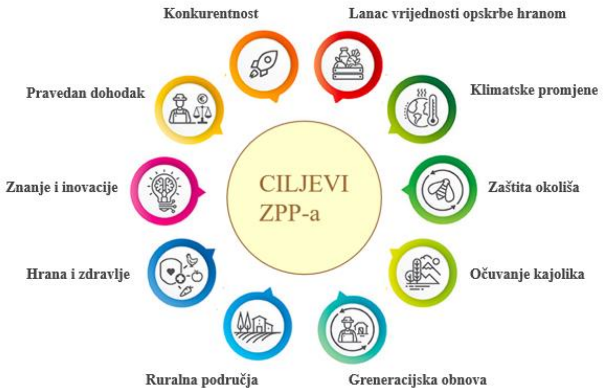
Slika 1. Ciljevi novog ZPP-a