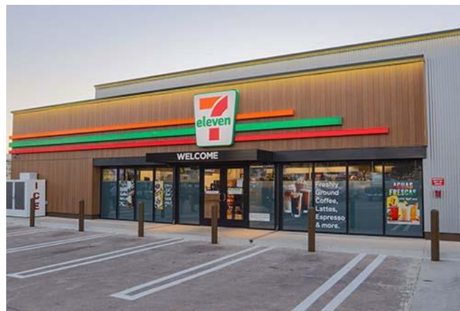
Slika 3. 7-Eleven trgovina