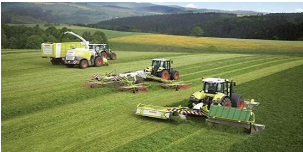
Slika 1. Poljoprivredna mehanizacija