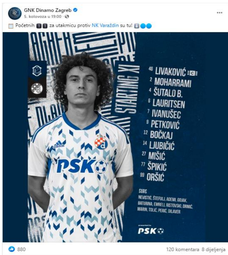
Slika 5: Izgled Facebook objave na službenom profilu GNK Dinamo Zagreb

Twitter sadrži identičan slikovni sadržaj sa malom modifikacijom u tekstualnom dijelu objave gdje za razliku od facebooka nije označen protivnik, u ovom slučaju Varaždin. Objava ima 46 reakcija sviđanja, 6 puta je podijeljena i sadrži jedan komentar.