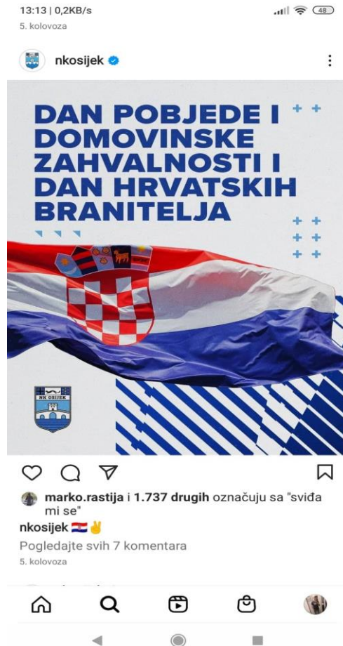
Slika 13: Izgled Instagram objave službenog profila NK Osijek

Uspoređujući objave iz prošlosti i one danas može se primjetiti jasan i znakovit napredak u kreiranju sadržaja na društvenim mrežama. Npr. objava neposredno prije utakmice sa sastavima izgleda drugačije, oku dopadljivije, modernije i puno je veća posveta klupskim bojama pri dizajnu. Objava kreirana 19.12.2015. na Facebook profilu Dinama prije susreta sa Interom iz Zapešića ima 531 oznaku "sviđa mi se", 57 komentara te 5 puta je podijeljena, dok je objava identičnog sadržaja 2022. ususret utakmici sa Varaždinom "lajkana" 880 puta, 120 puta je komentirana i podijeljena 8 puta što pokazuje jasan napredak aktivnosti i zainteresiranosti korisnika za objavljivanim sadržajem.