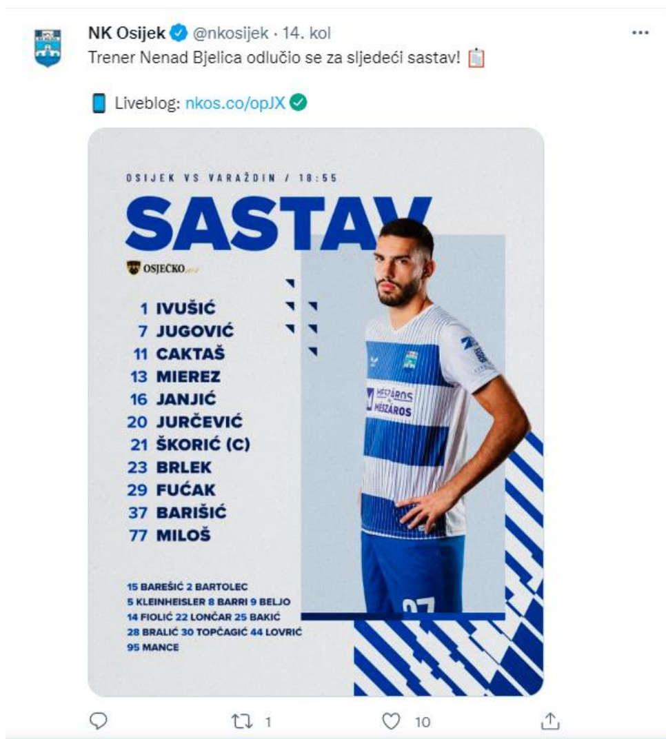
Slika 12: Izgled Twitter objave službenog profila NK Osijek Preuzeto sa: https://twitter.com/nkosijek (18.8.2022.)

Što se tiče Instagrama treba reći kako se objave ovakvog karaktera ne nalaze na toj službenoj platformi (18.8.2022.)