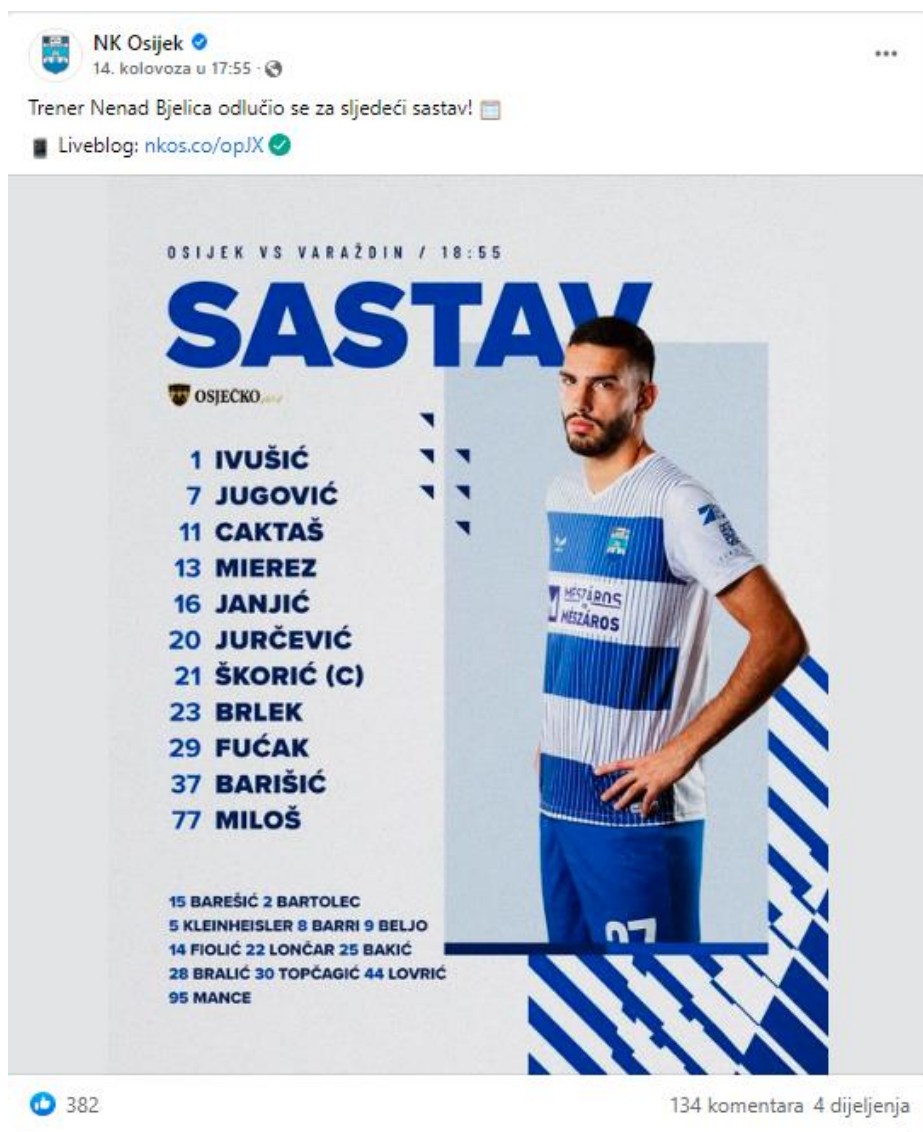
Slika 11: Izgled Facebook objave službenog profila NK Osijek Preuzeto sa: https://www.facebook.com/nkosijek (18.8.2022.)

započeti na klupi. Kao i kod Dinama, i ovdje postoji igrač koji je obučen u dres koji će ekipa nositi na predstojećoj utakmici. Dizajn je specifičan i korišten je u svim objavama kada je riječ o domaćim utakmicama. Na fotografiji može se vidjeti mali logotip Osječke pivovare koja je sponzor nogometnog kluba. Objava je prikupila 382 reakcije "sviđa mi se", komentirana je 134 puta, a podijeljena 4 puta.