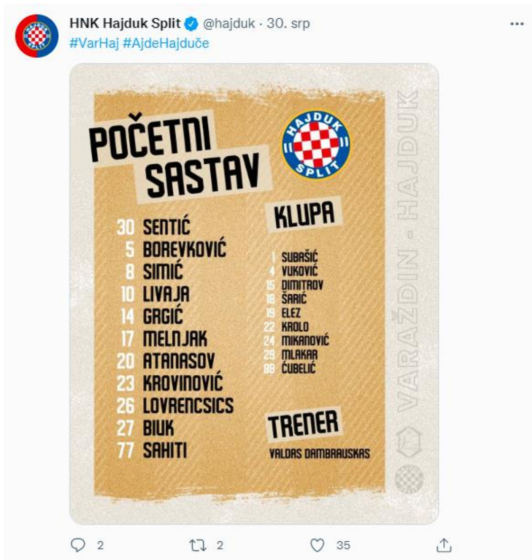
Slika 9: Izgled Twitter objave službenog profila HNK Hajduk Split

Objava putem Instagrama identična je prethodnima uz mali izuzetak u tekstualnom dijelu gdje je napisana jedna rečenica i jedan hashtag uz dodatak emojija. Objavu je 8 789 korisnika označilo reakcijom "sviđa mi se", a komentirana je 61 put (18.8.2022.)