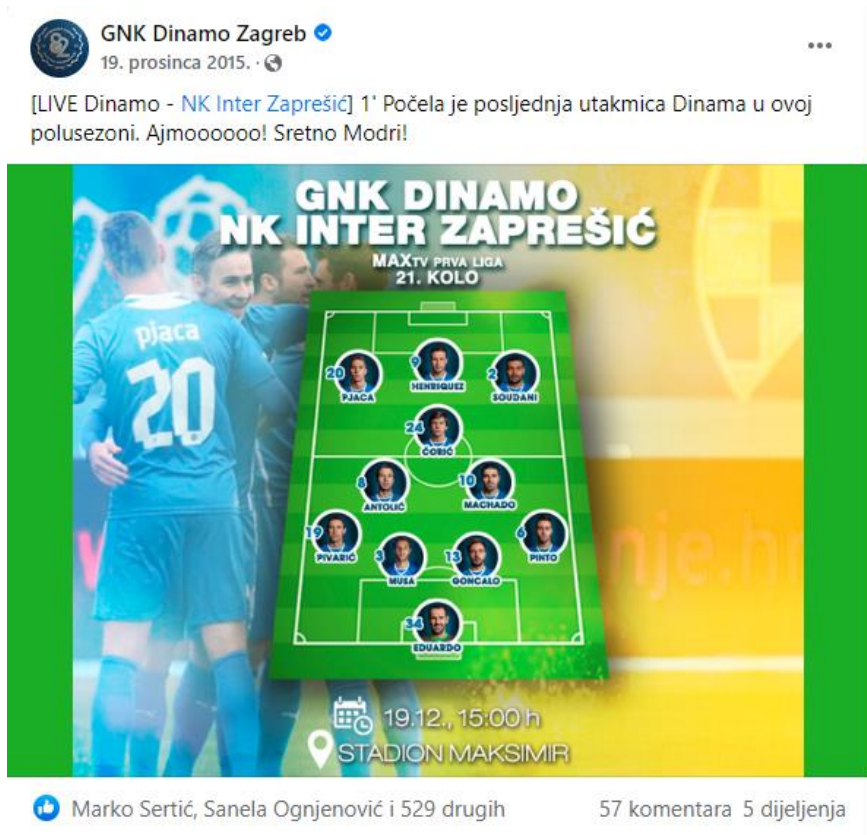
Slika 14: Dinamo objava 2015. Preuzeto sa: https://www.facebook.com/dinamo (19.8.2022.)

Osijek 2015. nije ni objavljivao takav sadržaj na Facebooku tako da je za potrebe ovog istraživanja uzeta objava iz 2016. godine. Objava je za svoje vrijeme bila veoma modernog dizajna i izgleda, naglašena je važnost klupskih boja, fotografija sadrži sve potrebne podatke vezane za utakmicu (početnih 11, igrači na klupi, izgled garniture dresa u kojima će momčad nastupati). Što se tiče numeričkih podataka, objava kreirana 27.8.2016. ima 161 reakciju "sviđa mi se", 4 komentara te je podijeljena samo jednom. Od 4 ukupna komentara jedan je od službenog profila Osijeka gdje je postavljena poveznica za tekstualni prijenos uživo. Usporedbe radi, 14.8.2022. pred utakmicu sa Varaždinom objava sadrži 382 reakcije "sviđa mi se", 134 komentara, a podijeljena je 4 puta. Također, kao i kod Dinama, vidi se jasan napredak zainteresiranosti i aktivnosti korisnika.