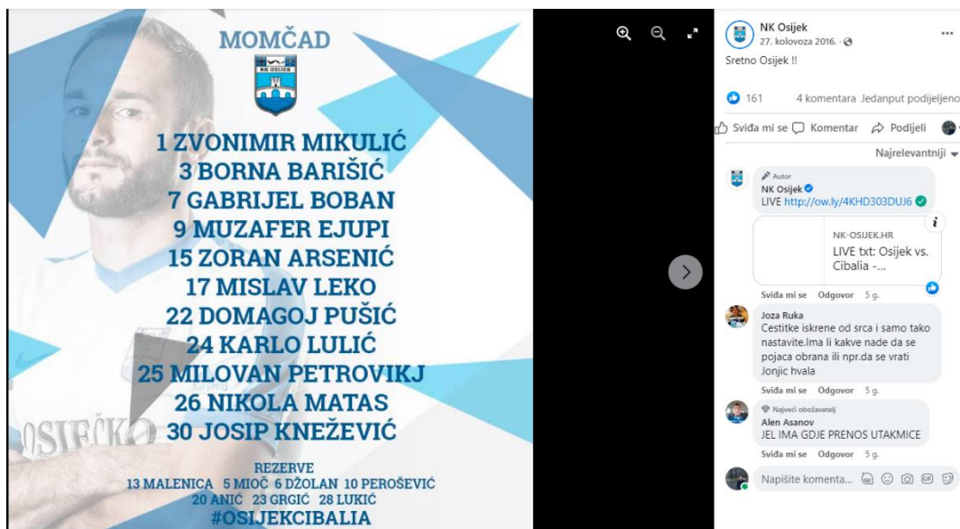
Slika 15: Osijek objava 2016. Preuzeto sa: https://www.facebook.com/nkosijek (19.8.2022.)

Najveći napredak ostvario je Hajduk. Njihova objava kreirana 8.3.2015. na Facebooku niti u najmanjoj mjeri ne liči na ovu danas. Objava sadrži fotografiju sa "lica mjesta", dok u tekstualnom djelu donosi početni sastav sa linkom na poveznicu za praćenje uživo. Što se brojki tiče, ta objava je dosegla 737 reakcija "sviđa mi se", 40 komentara, a podijeljena je jedanput. Za razliku od 2022. gdje objava prije utakmice daje gotovo sve podatke koji su potrebni korisniku sa modernim dizajnom koji je inspiriran bojama dresova koji će se koristiti u toj utakmici. Objava je "lajkana" oko 2 000 puta, komentirana je 178 puta, a podijeljena je 51 put. Iz prikazanog može se zaključiti kako je klub pokazao značajan napredak u kreiranju objava, a da je taj trud znala pokazati i zainteresirana publika koja je povećala svoju aktivnost. (19.8.2022.)