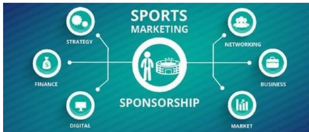
Slika 1: Sportski marketing