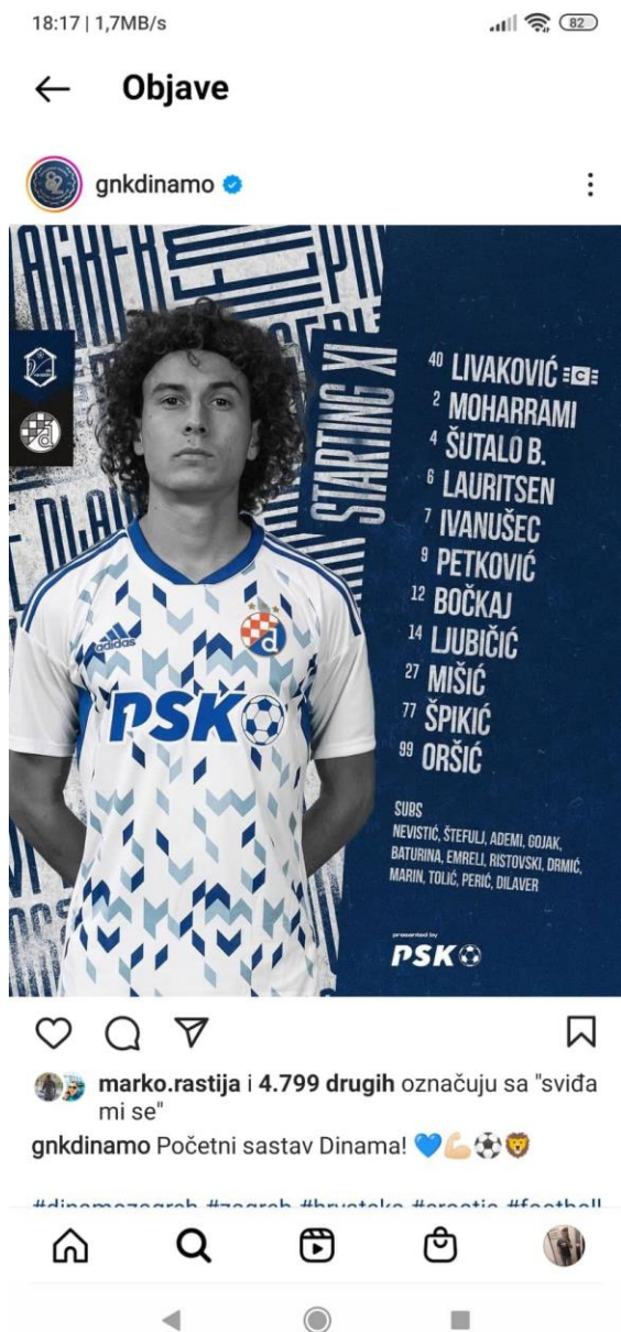
Slika 7: Izgled objave službenog Instagram profila GNK Dinamo Zagreb Preuzeto sa: https://www.instagram.com/gnkdinamo/ (18.8.2022.)

Hajduk je na Facebooku, za razliku od Dinama, za istog protivnika generirao je oko 2 000 reakcija "sviđa mi se", dobio 178 komentara i ta je objava bila podijeljena 51 put. Ono po čemu su karakteristične Hajdukove objave je malo veća količina teksta, specifičan dizajn koji je inspiriran bojom dresova koji će se koristiti na toj utakmici, imena početnih jedanaest, kao i imena pričuvnih igrača i trenera. Dizajn slikovne objave veoma je jednostavan i sadrži sve bitne informacije.