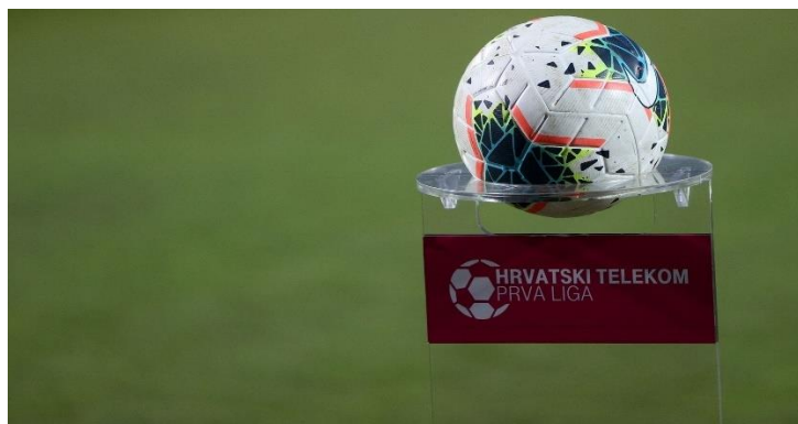
Slika 3: Primjer sponzorstva natjecanja