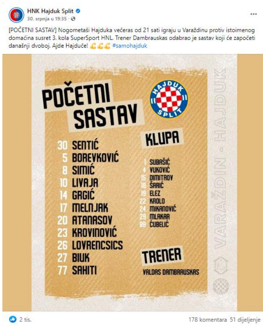
Slika 8: Izgled Facebook objave službenog profila HNK Hajduk Split

Što se Twittera tiče slikovni sadržaj je identičan onome na Facebooku. Razlika postoji u tekstualnom dijelu gdje su objavljena samo dva hashtaga. Putem Twittera Hajduk je dobio 35 reakcija "sviđa mi se", 2 komentara te 2 dijeljenja objave.