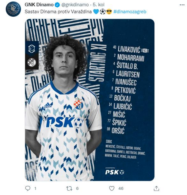
Slika 6: Izgled Twitter objave na službenog profilu GNK Dinamo Zagreb

Preuzeto sa: https://twitter.com/gnkdinamo?ref_src=twsrc%5Egoogle%7Ctwcamp%5Eserp%7Ctwgr%5Eauthor (18.8.2022.)