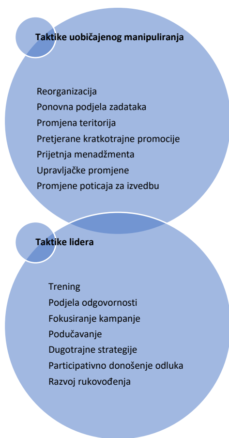
Slika 1. Taktike uobičajenog manipuliranja i taktike lidera

liderstva. Problem menadžera na visokim pozicijama i razlog zbog kojeg je njihova efektivnost kratkog vijeka, a rezultati koji nastupaju brzo ne zadržavaju se dugo, je taj što su nedovoljno vješti ili naučeni liderskim sposobnostima. Menadžeri smatraju da pokušajem manipulacije istovremeno izvršavaju aktivnosti vodstva. Većinom razlog neuspjeha leži u nedovoljnoj razvijenosti liderskih sposobnosti. Lideri moraju, stoga, biti promišljeni i odlučni pri odlučivanju, a manipulacijom se moraju koristiti onda kada ona može donijeti rezultate umjesto da im manipuliranje prijede u naviku. Postoje taktike koje su vezane za liderstvo i manipulaciju te se nerijetko posredstvom istih može uočiti prava razlika (Bekavac, 2021:14). Slika 1. prikazuje taktike uobičajenog manipuliranja i taktike lidera.