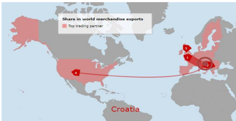
Slika 3 Izvoz Republike Hrvatske prema najvećim partnerima (www.wto.org, 2022.), [pristupljeno: 15. svibnja 2022].

Općenito gledano, u posljednje dvije godine Republike Hrvatska nije pokazala najbolje učinke u djelovanju unutar WTO-a. Prema podacima objavljenim u posljednjih nekoliko tromjesečja, vidljivo je kako RH bilježi lagani i blagi porast kroz mjesec. Za WTO taj porast je i zanemariv u odnosu na ostale članice, no potrebno je uzeti u obzir i stanje gospodarstva uzrokovano pandemijom COVID-19 u RH i u svijetu općenito.