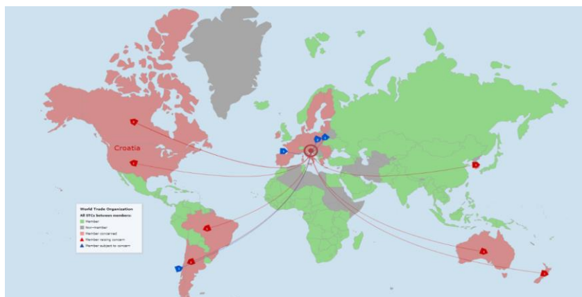
Slika 4 Specifični trgovinski problemi Republike Hrvatske i partnera (www.wto.org, 2022.), [pristupljeno: 15. svibnja 2022].

Članice i promatrači WTO-a redovito održavaju rasprave o specifičnim trgovinskim problemima (engl. STC). Na navedenim raspravama najčešće se raspravlja o nacrtima zakona, propisa ili postupaka koji utječu na trgovinu. Prije stupanja na snagu, članice su dužne obavijestiti odbor o svim budućim mjerama koje stupaju na snagu. U osnovi, članice održavaju STC rasprave kako bi saznale više informacija o opsegu i provedbi međusobne regulative u svjetlu temeljnih obveza nadležnih odbora te kako bi poticale potencijalne učinke na trgovinu.