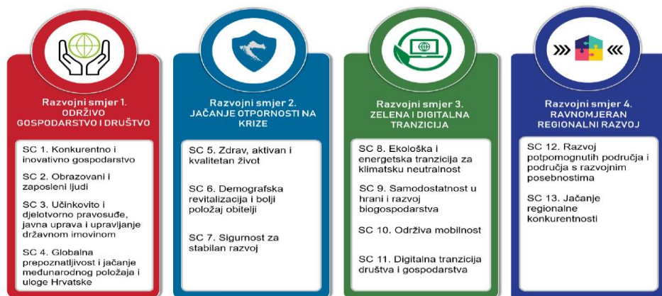
Slika 5 Razvojni prioriteta i strateški ciljevi NRS-a 2030. ( https://narodne-novine.nn.hr/clanci/sluzbeni/2021_02_13_230.html ), [pristupljeno: 10. lipnja 2022].