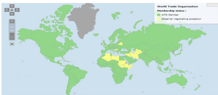
Slika 1 WTO - zemlje članice ( www.wto.org ), [pristupljeno: 07. svibnja 2022].

upravljačke prirode. Zadatak direktora je nadzor tajništva WTO-a koji broji oko 700 djelatnika. Imenuju ga članice WTO-a na mandat od četiri godine. ( https://stats.wto.org/ )