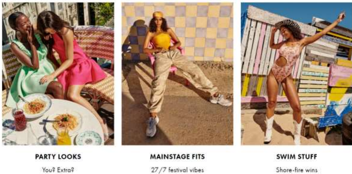
Slika 2 Primjer selektivne percepcije internet trgovine ASOS, izvor: asos.com, pristupljeno 26.6.2022.

2, stvara se selektivna percepcija, tako što od početne stranice kupcu pruža ideja gdje određenu odjeću nositi. Specifično za ASOS, mogu se pronaći kategorije poput odjeće za festivale, za roštilj, za ljetne izlaske i dr.