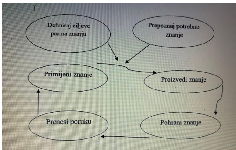
Slika 3. Proces upravljanja znanjem

U nastavku slika 3 prikazuje proces upravljanja znanjem koji se sastoji od šest temeljnih stavki, a to su definiranje ciljeva prema znanju, prepoznavanje potrebnog znanja, primijene znanja, proizvodnja znanja, pohrana znanja i prenošenje poruka.