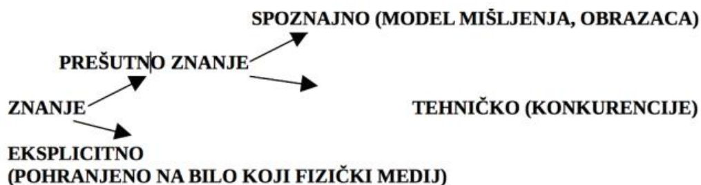
Slika 2. Struktura znanja