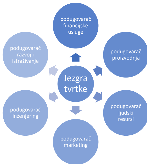
Graf 2 Prikaz modularne organizacije