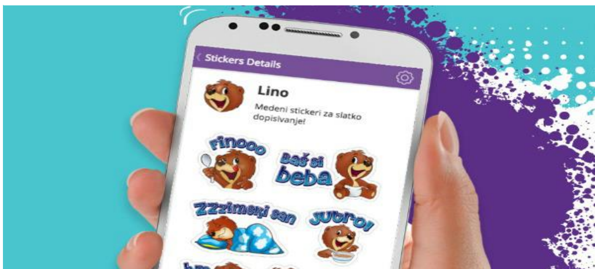
Slika 2 Lino Viber naljepnice

Nova Coolinarika osvojila je i nagradu MIXX za najbolju internetsku stranicu u 2021. godini (Podravka, 2022:29). Podravka je s korisnicima još 2015. počela komunicirati putem Viber Public Chata (Kolić, 2017). Koristile su se Lino (slika 2) i Kviki naljepnice za Viber, no one su se prestale primjenjivati te danas više nisu dostupne. Nije poznat razlog takve odluke, no za pretpostaviti je da takva praksa rezultirala troškovima, a s vremenom nije više davala rezultate.