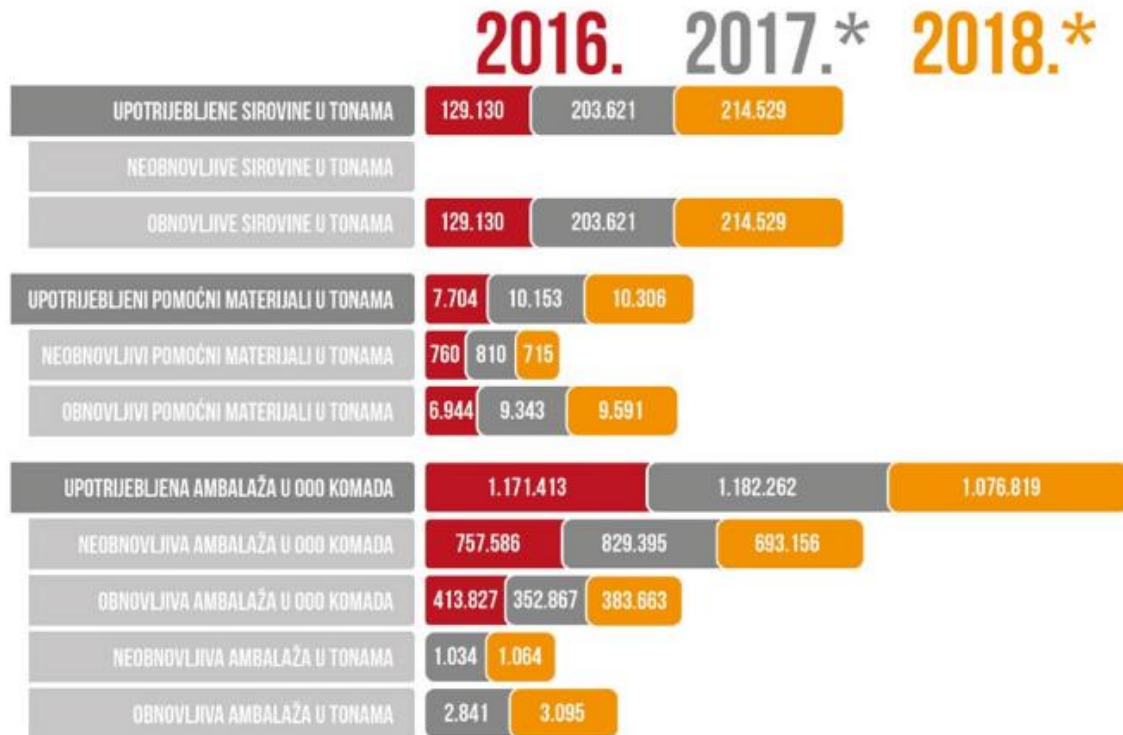
Slika 4 Upotrijebljeni materijali u proizvodnji i pakiranju proizvoda

*Podaci za 2017. i 2018. godinu obuhvaćaju i upotrijebljene materijale u proizvodnji i pakiranju proizvoda Grupe Žito odnosno prikazuju upotrijebljene materijale u cijeloj Grupi Podravka