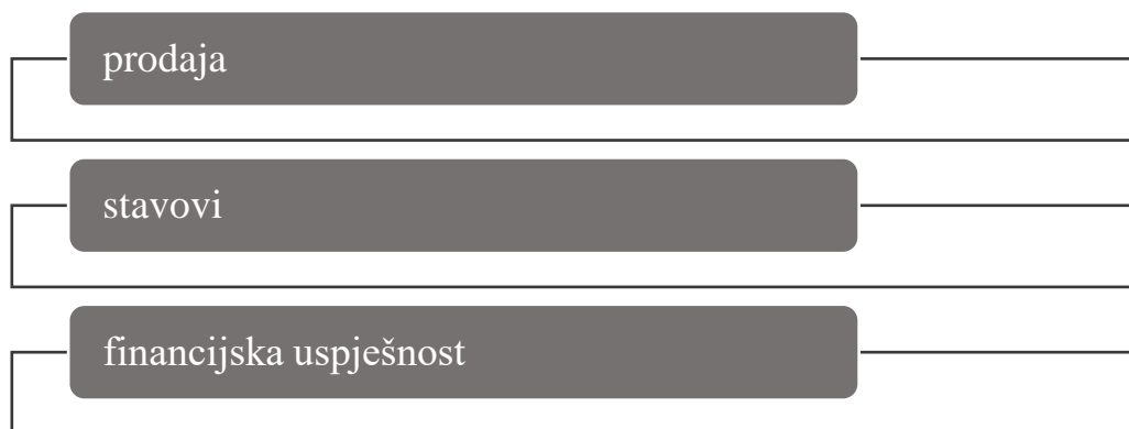
Grafikon 1. Tri različita aspekta marketinške strategije