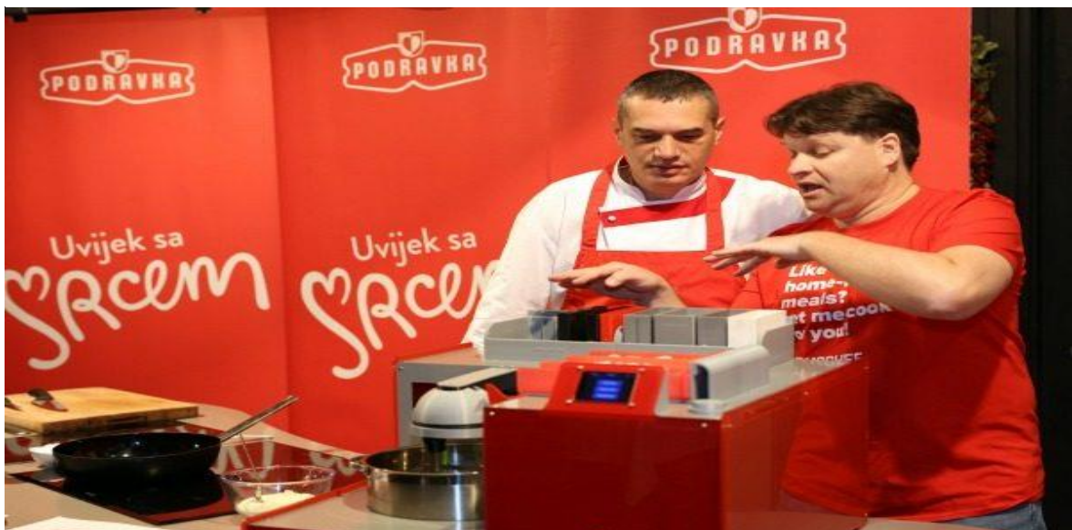
Slika 3 Podravkin robot kuhar

Podravka je od 2016. godine počela ulagati i u start up projekte, od kojih je jedan i robot kuhar GammaChef (slika 3). Ovo je ujedno i primjer strateškog partnerstva sa Gammachefom, što pokazuje da se u poduzeću provodi kvalitetno upravljanje odnosima s interesnim skupinama. Robot radi na način da automatski priprema jela u jednom loncu, odnosno automatski dodaje hrane i sastojke iz spremnika sukladno unaprijed zadanom digitalnom receptu.