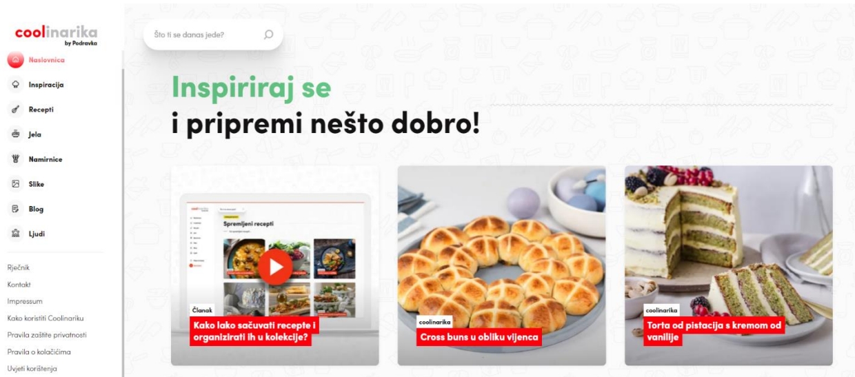
Slika 1 Podravkin internetski portal Coolinarika