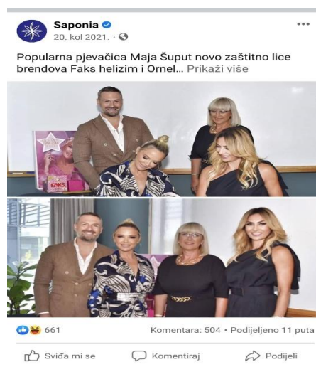
Slika 5 Objava suradnje Saponije i Maje Šuput na službenom Facebook profilu Saponije

Saponia tijekom cijele kampanje komunicira sa svojim potrošačima putem društvenih mreža te o svim aktivnostima ih informira putem Facebooka, Instagrama, YouTubea, LinkedIna. Osim na službenim profilima Saponije informacije o aktivnostima kampanje objavljene su i na društvenim mrežama brend ambasadorice Maje Šuput. Na slici 5 je prikazana objava na službenom Facebook profilu Saponije o početku suradnje Saponije i Maje Šuput.