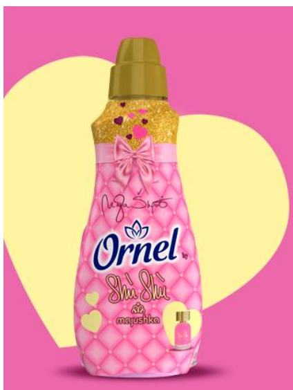
Slika 4 Ornel Shù Shù

osigurava i potpunu zaštitu tkanine. Kada se nosi omiljeni odjevni predmet, Ornel svakim pokretom tijekom oslobađa dašak citrusno-slatke cvjetne kompozicije, pružajući na taj način odjevnom predmetu neodoljiv luksuzan osjećaj. Ornelom Shù Shù potrošači su pozvani da uđu u svijet luksuza i uživaju u svakom trenutku te da izraze svoju osobnost i uživaju u svim osjetilima na Ornel način. Na slici 4 prikazan je Ornel Shù Shù.