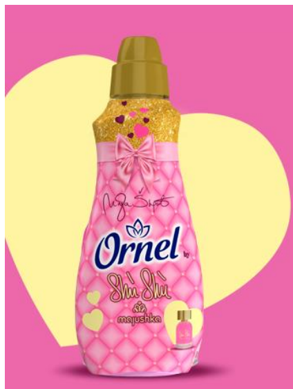
Slika 4 Ornel Shù Shù

osigurava i potpunu zaštitu tkanine. Kada se nosi omiljeni odjevni predmet, Ornel svakim pokretom tijekom oslobađa dašak citrusno-slatke cvjetne kompozicije, pružajući na taj način odjevnom predmetu neodoljiv luksuzan osjećaj. Ornelom Shù Shù potrošači su pozvani da uđu u svijet luksuza i uživaju u svakom trenutku te da izraze svoju osobnost i uživaju u svim osjetilima na Ornel način. Na slici 4 prikazan je Ornel Shù Shù.