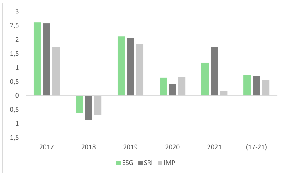
Grafikon 4: Sharpeov omjer ESG, SRI i impact fondova u periodu od 2017. – 2021. godine i prosječni Sharpeov omjer razdoblja