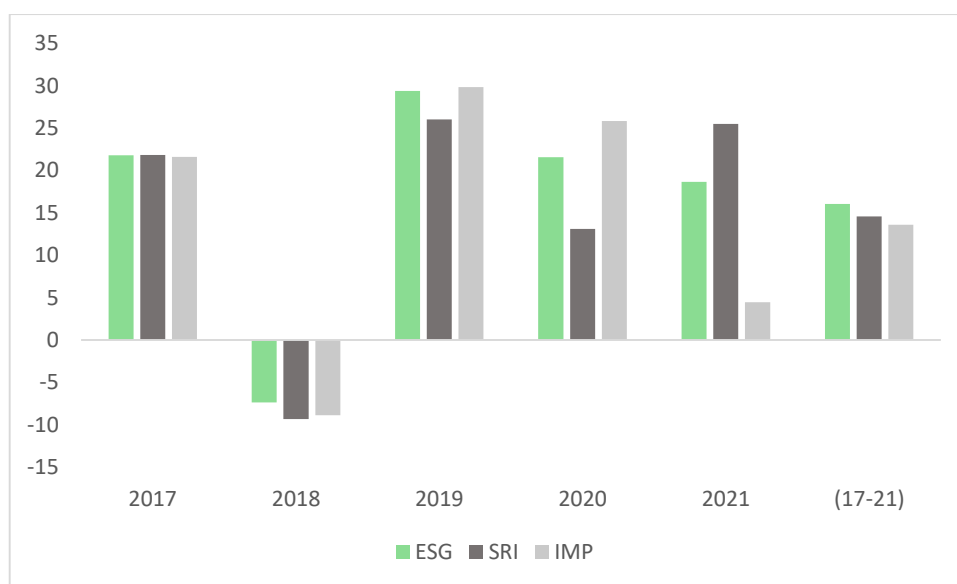
Grafikon 2: Prinos ESG, SRI i impact fondova u periodu od 2017. – 2021. godine