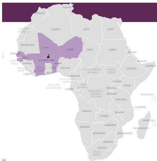
Slika 2. Prikaz članica Zapadnoafričke ekonomske i monetarne unije.

Ako usporedimo europsku Ekonomsku i monetarnu uniju i Zapadnoafričku monetarnu i ekonomsku uniju, na području Zapadnoafričke monetarne unije ostvarilo se samo jedno proširenje. Slika 2. prikazuje države članice Zapadnoafričke monetarne unije, te prema podacima WAEMU prvotnu zajednicu Zapadnoafričke monetarne i ekonomske unije činile su: Benin, Burkina Faso, Obala Bjelokosti, Mali, Niger, Senegal i Togo. Države članice su potpisale ugovor 1. kolovoza 1994. godine, dok se 2. svibnja 1997. godine uniji pridružuje Gvineja Bisau.