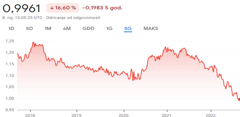
Slika 3 Tečaj eura u odnosu na američki dolar