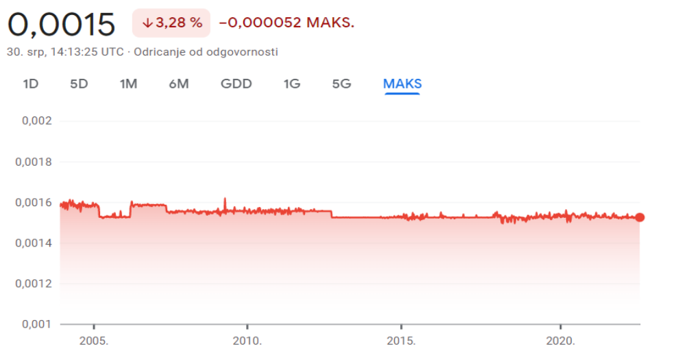
Slika 4. Fluktuacija CFA franka u odnosu na euro