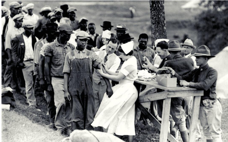
Slika 2 Sudionici eksperimenta u Tuskageeju