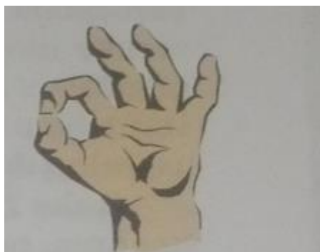
Slika 4: Znak OK

Slika 4 prikazuje položaj prstiju koji tvore slovo O. To je prepoznatljiva gesta jer simbolizira znak OK. Značenje OK označuje kako je sve u redu, znak garancije ili odobravanja. Ovaj znak u nekim kulturama ipak označava nešto loše ili negativno. Primjer tome je da u Francuskoj znak OK znači bezvrijedno ili nula, a u Japanu ova gesta označava novac, a Njemačkoj i Brazilu se smatra nekulturnom i može uvrijediti osobu kojoj je gesta namijenjena.