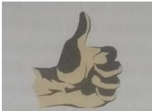
Slika 3: Palac gore

Slika 3 prikazuje gestu stisnute šake s palcem prema gore. Bovee i Thill (2012) objašnjavaju kako ova gesta u SAD-u izražava mnoštvo pozitivnih značenja, od da do dobro obavljen posao. No ova gesta nema u svim kulturama pozitivno značenje. Neke kulture vjeruju da je ta gesta uvredljiva, u Njemačkoj znači jedan, a u Japanu pet. U mnogim se kulturama ova gesta koristi kao znak za autostopiranje ili kao oznaku za nešto dobro i točno.