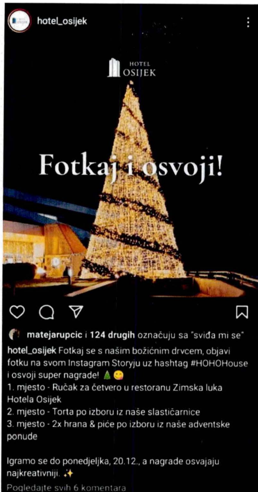
Slika 2 Nagradna igra - Hostel Osijek {prema hostel_osijek, 2021.}

Na svim recenzijama se najviše ističe ljubaznost i uslužnost osoblja, koji su na raspolaganju 0-24 za sva pitanja i nedoumice. (Booking, 2022.)