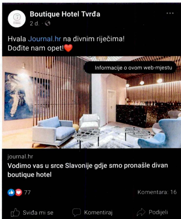
Slika 3 Preporuka Boutique Hotel Tvrđa (Boutique Hotel Tvrđa,2022.)

Nešto manji hotel se smjestio u starom gradu, u Tvrđi. Boutique hotel Tvrđa je luksuzni hotel s 15 soba i 30 kreveta. Interijer je kombinacija baroknog ugođaja u čijem se okruženju nalazi i modernog dizajna. Gosti se mogu koristiti saunom, knjižnicom i restoranom, a ono što ovaj hotel čini posebnim je otvoreni bazen i jacuzzi na vrhu zgrade s pogledom na stari grad. Iz prethodne tablice se može uočiti da je cijena najjeftinija od tri ponuđena smješta i to s najboljom ocjenom. U recenzijama je najviše hvaljena osoblje koje je susretljivo i nasmijana te sadržaj koji se nalazi na krovu. (Booking, 2022.) Web stranica je uredna, ali sažeta. Samo su navedene glavne informacije. Koriste Facebook i Instagram od društvenih mreža. Objave nisu toliko česte, ali su kvalitetne. Na slici br.3. je prikazano kako na Facebook-u dijele članak gdje ih druge stranice preporučuju za odmor. Ovo je prikaz da imaju dobru reputaciju i da su prepoznatljivi i na dalje.