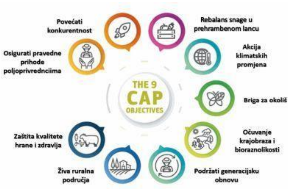
Slika 2. Devet ciljeva Zajedničke poljoprivredne politike

Primarni ciljevi Zajedničke poljoprivredne politike objedinjuju sve gospodarske djelatnosti koje politika financira i koje poljoprivredna politika želi poboljšati u pojedinim zemljama. Svih devet zajedničkih ciljeva zajedno žele ostvariti savršenu poljoprivredu unutar zemlje. Zaštitom kvalitete hrane i zdravlja, podržavanjem generacijske obnove, očuvanjem krajobraza i bioraznolikosti, brigom za okoliš, akcijom klimatskih promjena te rebalansom snage u prehrambenom lancu ne obraća se pozornost samo na poljoprivredu već se pažnja stavlja na cjelokupnu prirodu i sva bogatstva unutar nje (Ips konzalting, 2020).